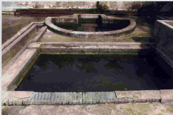
既济亭热水池（市级文物保护单位）

既济亭热水池位于城北2公里处，占地面积约60平方米，明代正德年间（1506—1521年），始用砖石砌池，是崖州最早开辟利用而修建的温泉。清光绪十五年（1889年），知州唐镜沅组织重修，由拔贡何秉礼规划、州同尹图南监修，建既济亭于上，供热水公于庙，题联咏诗，并勒碑“既济亭热水池碑记”。