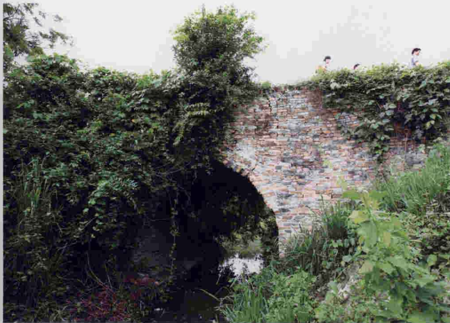
广济桥（市级文物保护单位）

位于城东南二里（崖城糖厂东南）南沟上。明代景泰年间（1450—1456年）始建木桥，清初改建单拱砖桥。清康熙九年（1670年）广度寺性俊和尚募资建造，桥长20米，宽4.5米，拱高16米。单孔砖石混砌拱桥，东西走向，横跨官沟之上。拱桥至今仍通行人车，是三亚市现存年代最早的古桥。桥面与栏杆已损毁。