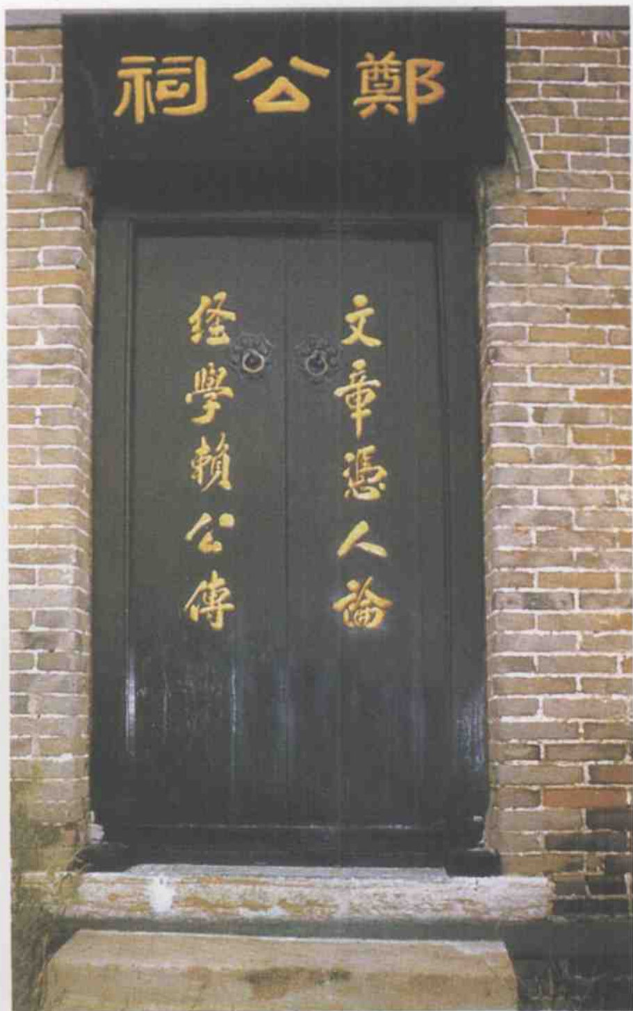
高密市双羊镇后店村郑公祠门联