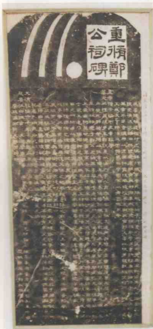
清重修郑公祠碑拓片