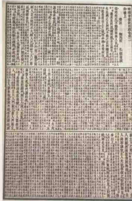
郑玄注《周礼注》《仪礼注》《毛诗传笺》《礼记注》（《十三经注疏》本）