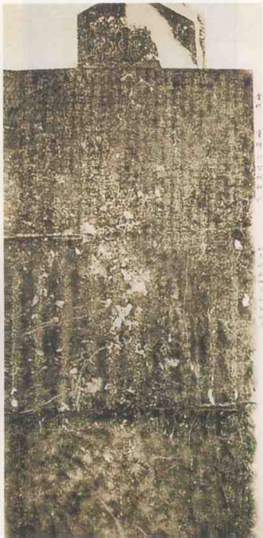
金代重修郑公祠碑拓片