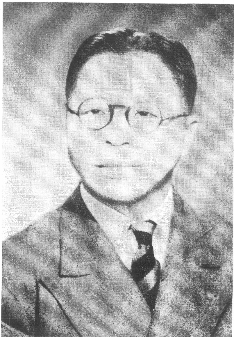
吳 市 長 玉 照