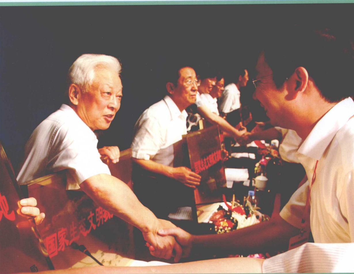
全国人大常委会副委员长周铁农等领导同志向荣获“国家生态文明教育基地”称号的单位颁发奖牌