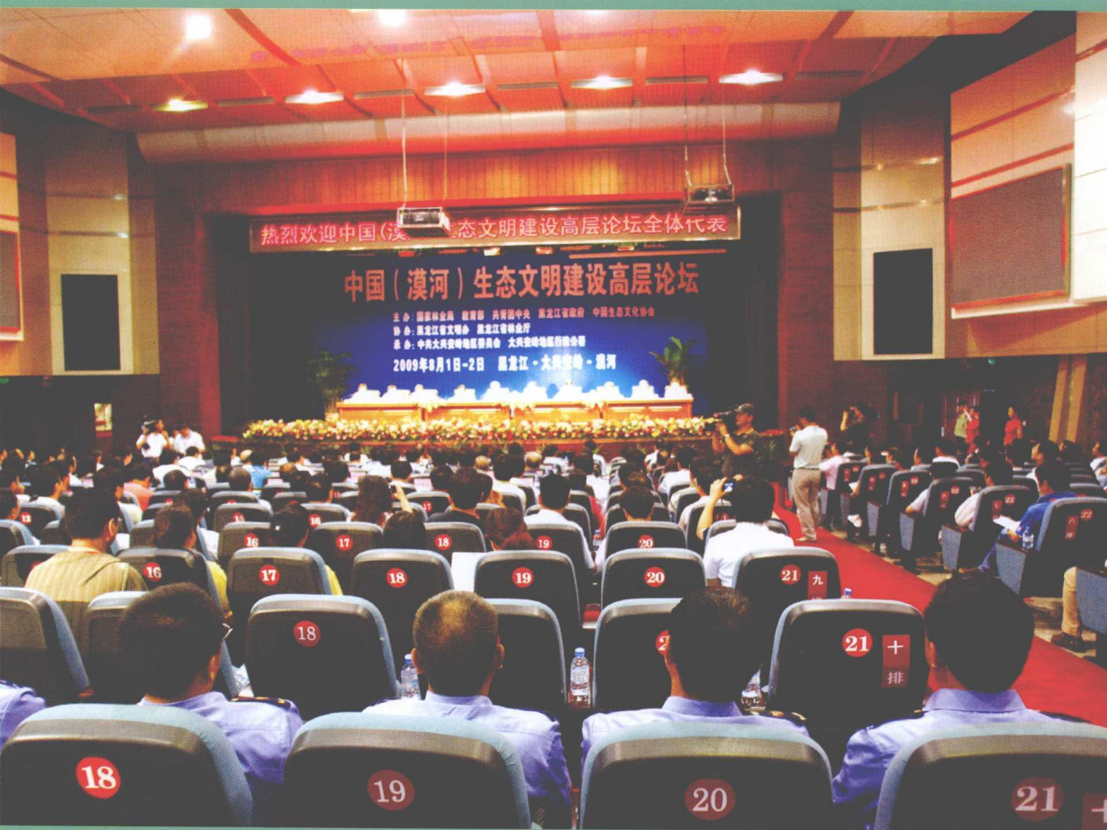
第二届中国（漠河）生态文明建设高层论坛会场