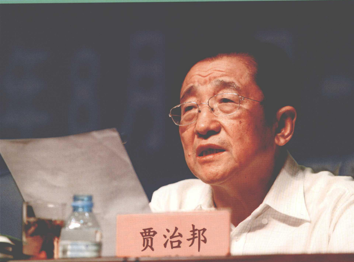
全国绿化委员会副主任、国家林业局局长贾治邦在论坛开幕式上发表重要讲话