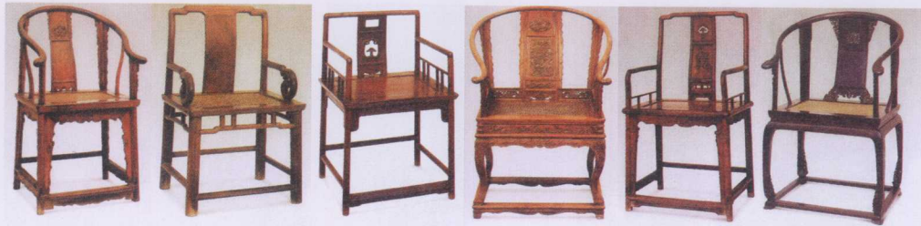
图1-5 明朝官帽椅，统一型制？大相径庭！代表着华夏文化的精髓和内敛