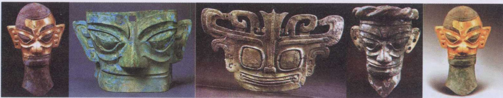
图1-2 “三星堆”瞪目铜人像，使中华文明的发源和组成，溯回到更遥远的想象乾坤