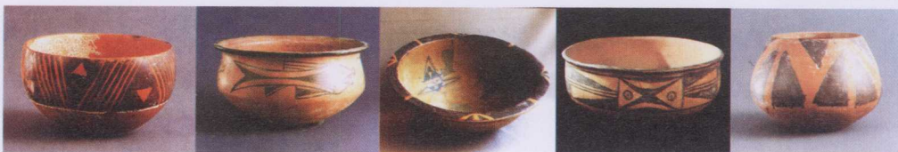
图1-1 仰韶文化彩绘陶盆表明，毛笔的出现，首先不是用于写字的，也显示古代工匠精湛手艺