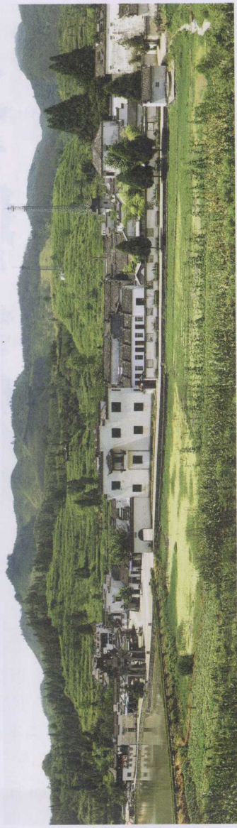
图1-7 天人合一理念，使华夏的自然、社会、人文处处充满文化气息