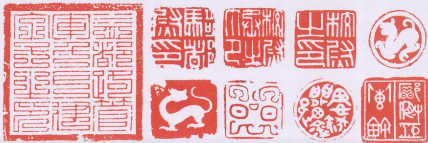
图1-4 阴凹阳凸的印章，是活字印刷术的祖师，更是中华民族“和”文化的理念、造化、集成