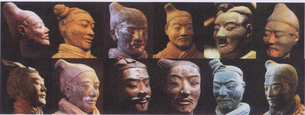
图1-3 秦始皇陵中“兵马俑”生动的造像，讴歌传颂二千多年前艺人匠者伟大创造力的不朽；“兵马俑”不同帽服的二十个军衔，与今天完全一致，秦人设计创造了军队的体制