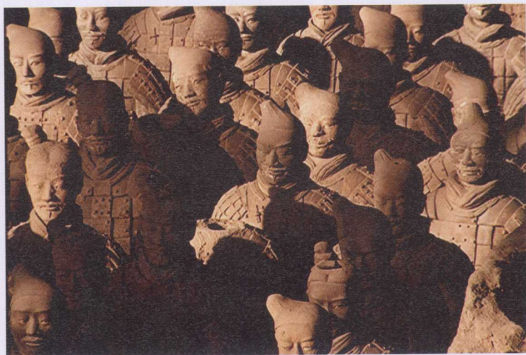
图2-1 20世纪70年代初,两个农民打井的偶然发现,挖掘出“世界第八大奇观”——秦始皇兵马俑。对这座规模宏大陵寝陪葬的深入研究,一个两千多年前的人文全景展现于世

构成论于实践意义的最显著效果,很难与新材料、新工艺、新加工方法摆脱干系。从石器、陶土(见图2-1)、青铜、钢铁,到电气、电子、半导体、生物医药……每一种新材料、新工艺、新加工方法,都会促成人类社会的生活、学习、工作、娱乐发生崭新变化,当然人类的视觉观亦发生崭新变化,包括价值观、审美观。