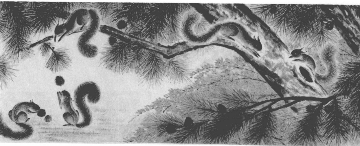
金鼠迎春岁岁丰 景浩绘 2800mm×50mm