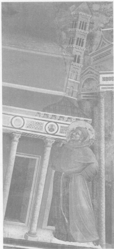
图0.2 创造性的应战：一位身材中等、谦恭卑微的穷人用自己的脊背顶住了拉特兰教堂，使它免于倾覆；这是梦境中精神的拯救者；一个文明的成长有赖于具有创造力的少数人；这些精英不仅必须有能力成功地应对他们所在社会遇到的挑战，而且必须具有将没有创造力的大多数人凝聚到自己身边的力量

事实上，这包含了某种价值的抉择。每种抉择都代表着无法解脱的冲突和割舍。知识重建必然要经历抉择与扬弃的过程。在五四运动前后，中国知识界曾兴起过一场较