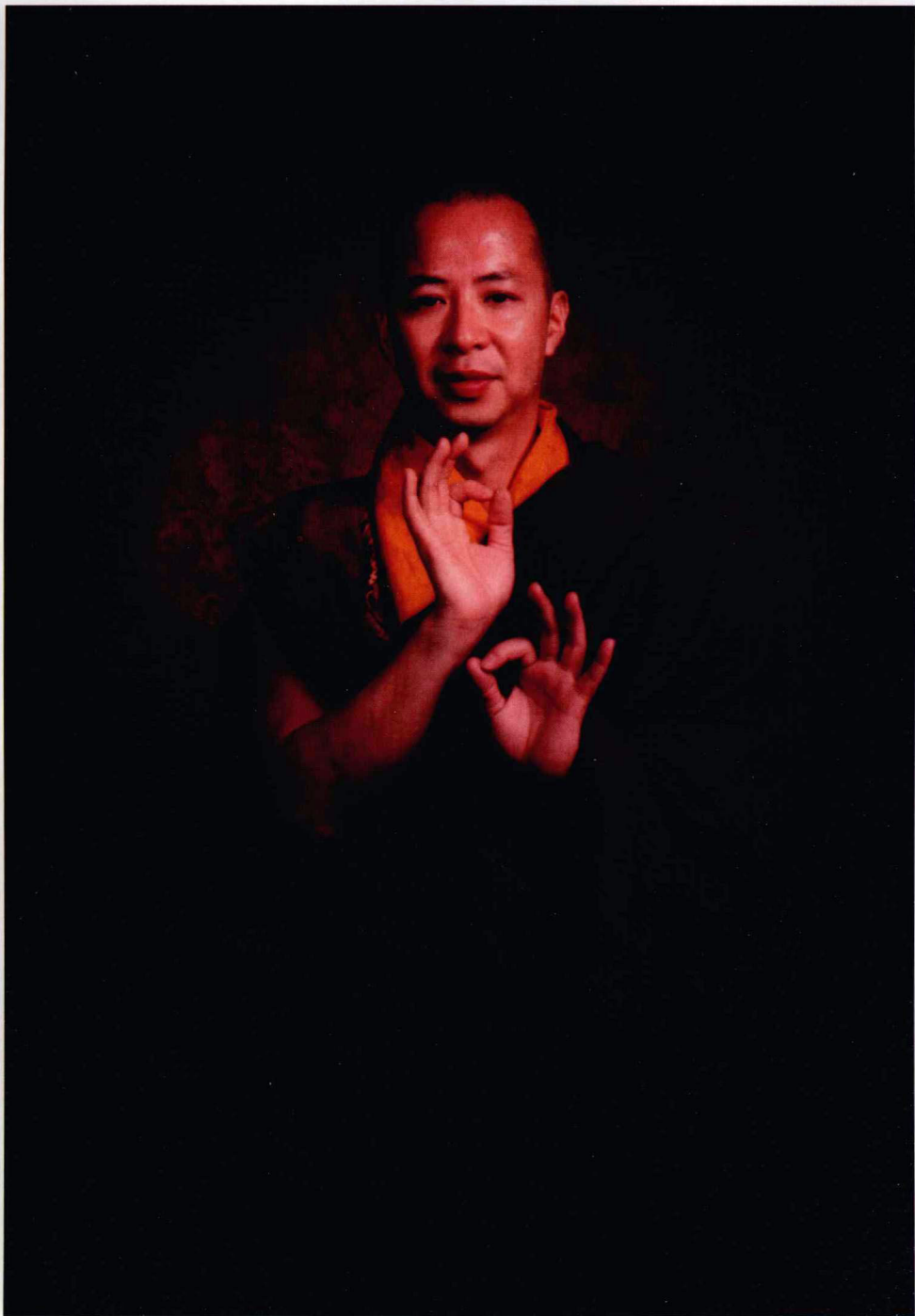
金剛上師 卓格多傑傳講