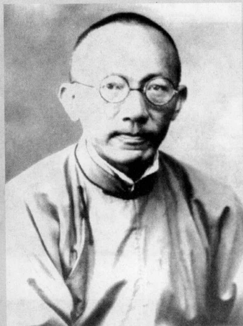
▲ 近代学者、1921年8月被广州革命政府委任为广西省省长的马君武