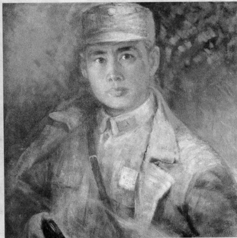
▲ 1945年于桂林保卫战中牺牲的城防司令部中将参谋长陈济桓将军