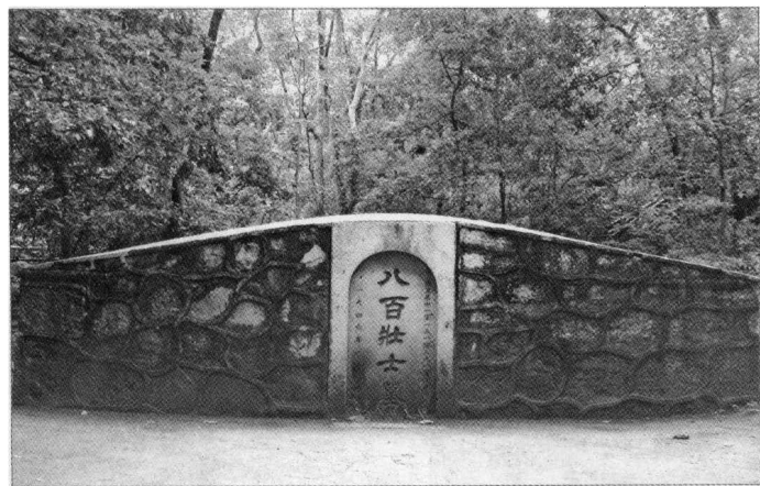
▲ 位于七星公园内的抗日忠魂八百壮士墓