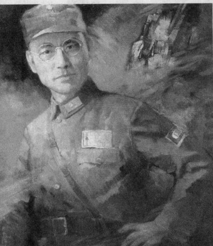
▲ 1945年于桂林保卫战中牺牲的桂军第131师师长阚维雍将军