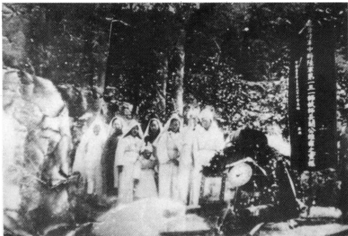
◀ 抗战胜利后，人们含泪合葬阚维雍、陈济桓、吕旂蒙三将军和八百壮士忠骸于桂林普陀山博望坪