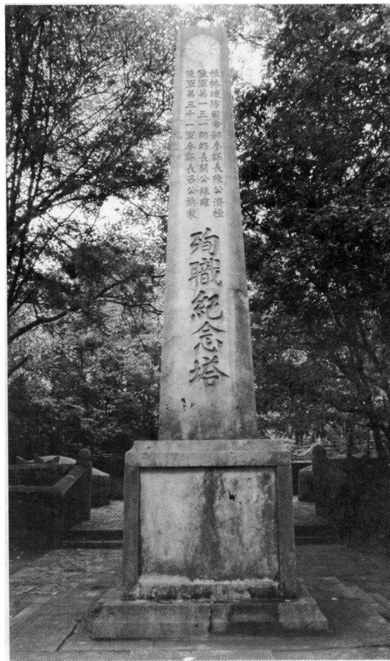
▲ 位于桂林普陀山博望坪的三将军殉职纪念塔