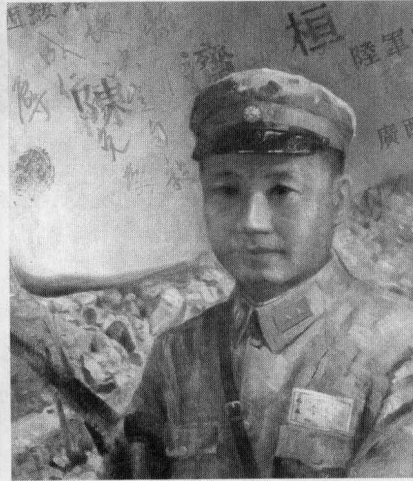
▲ 1945年于桂林保卫战中壮烈战死在德智中学的31军少将参谋长吕旂蒙将军