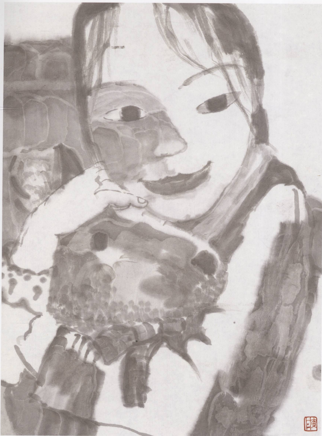
萧萧 2003年 纸本水墨