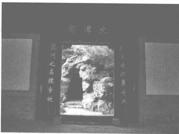
承德文津阁，是乾隆三十九年（1774年）仿浙江宁波天一阁而建。

众人不能对，唯独纪晓岚，应声对道：“两木成林，林下示禁，禁曰：斧斤以时入山林。”对联天衣无缝，贴切自然。