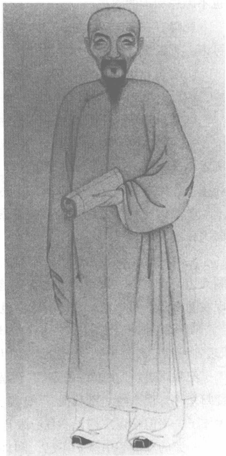
纪晓岚画像。纪晓岚学识极为渊博，号称“无书不读，博览一世”，以文采名满天下，炉火纯青的文字功夫让人叹为观止，纵性放欲的个性在文字狱盛行的有清一代也非常有名。

纪晓岚道：“皇上在这里览此江天，就请用‘江天一览’四字。”乾隆一听，这四个字气势磅礴，十分得体，喜道：“好，就这四个字了。”和坤恭维道：“皇上圣才，这四个字气势不凡，又符合今天的意境，真是太合适了！”倒好像这四个字是皇上想出来的一样。