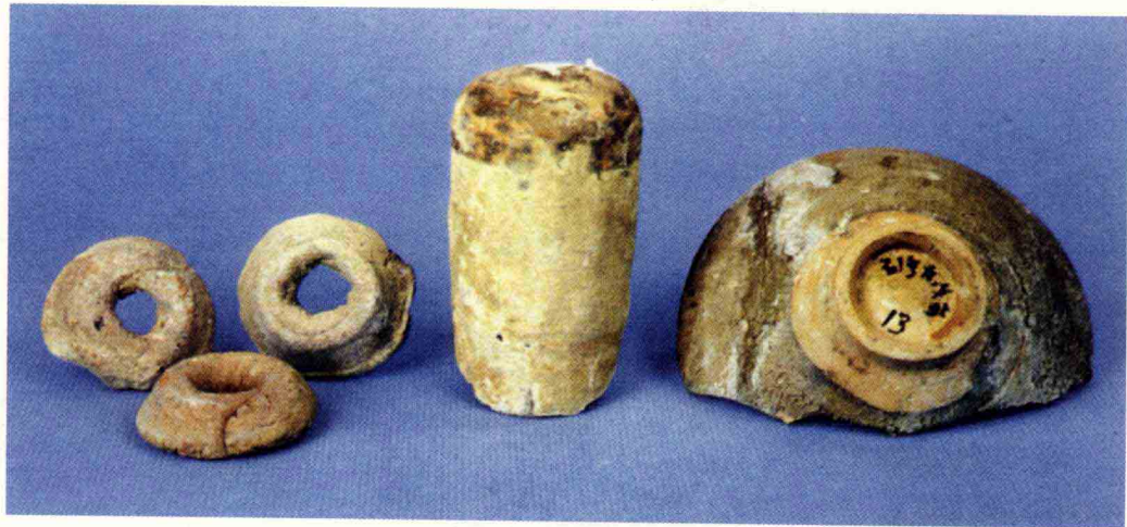
(宋) 石湾大雾岗第二层出土宋代黑釉三足炉及陶器残片

“石湾公仔”艺术经历了千百年的沉淀，具有很高的历史价值、科学价值和艺术价值，被誉为东方艺术明珠，在中国陶瓷艺术史上有着不可替代的作用。2006年，“石湾公仔”技艺等六个项目入选第一批国家非物质文化遗产名录，“石湾公仔”技艺等八个项目入选广东省第一批非物质文化遗产名录。此外，佛山石湾还获得“中国陶瓷名