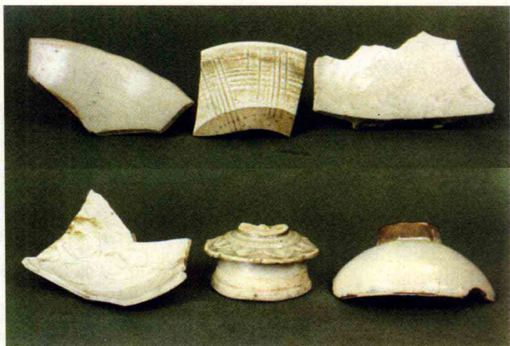
(北宋) 石湾古窑址出土北宋陶瓷片

新中国成立后，石湾陶塑全面发展，首先，老一辈陶瓷艺人以传、帮、带的方式培养了大批人才，加上上级文化部门选派了一批有美术专长的干部到石湾；其次，石湾陶艺家注重艺术理论的学习和创作经验的总结，注重用理论和一定的艺术观念来指导自己的艺术实践；最后，他们既进行现代陶艺探索，创作了大量具有现代审