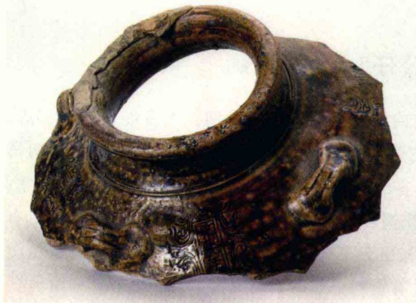
(宋·政和六年) 酱釉四系残片

“石湾公仔”艺术是在日用陶器的基础上发展起来的，最早可追溯到新石器时代，从石湾东汉墓出土的陶塑可见其雏形。“石湾公仔”艺术有人物陶塑、动物陶塑、器皿、微塑、瓦脊陶塑五大类，其中以人物造型为代表。“石湾公仔”善于吸收各种文化艺