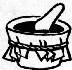
把锯木灰放在研碗上磨下来