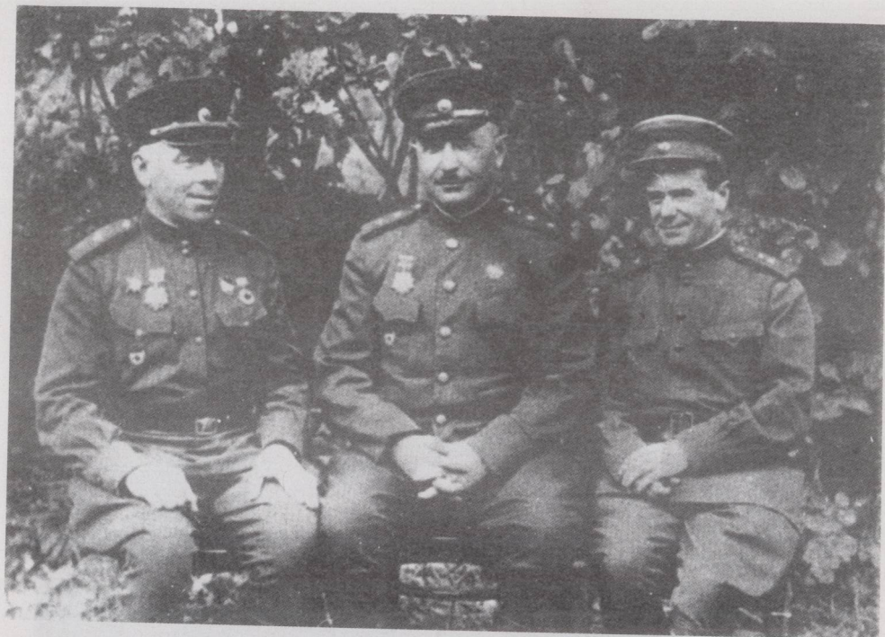
从左至右，近卫第11集团军军事委员会委员库里克委近卫第11集团军司令员巴格拉米扬，近卫第11集团军副司令员拉扎列维奇