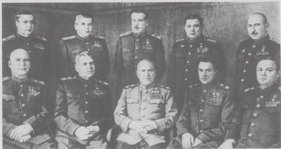
1945年卫国战争末期各方面军司令员合影。前排(自左至右): 苏联元帅科涅夫、华西列夫斯基、朱可夫、罗科索夫斯基、梅列茨科夫。后排: 托尔布欣、马利诺夫斯基、戈沃罗夫、大将叶廖缅科、巴格拉米扬。