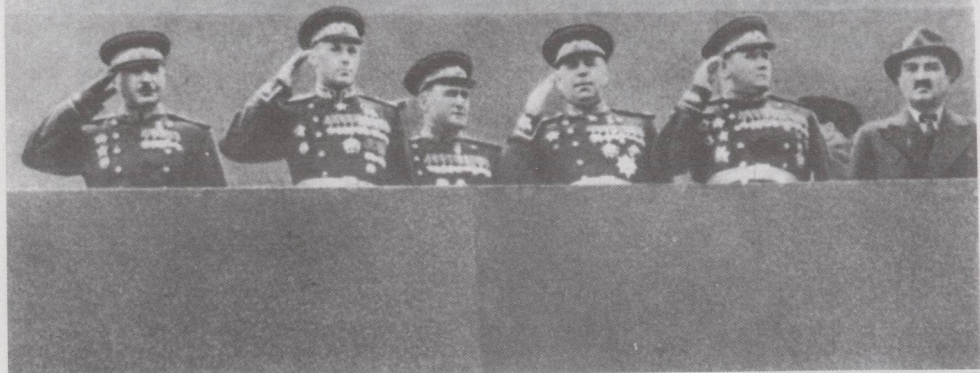
胜利阅兵式。各方面军司令员在列宁陵墓检阅台上