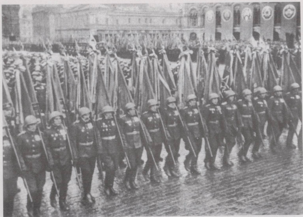
胜利阅兵式。旗手在前进