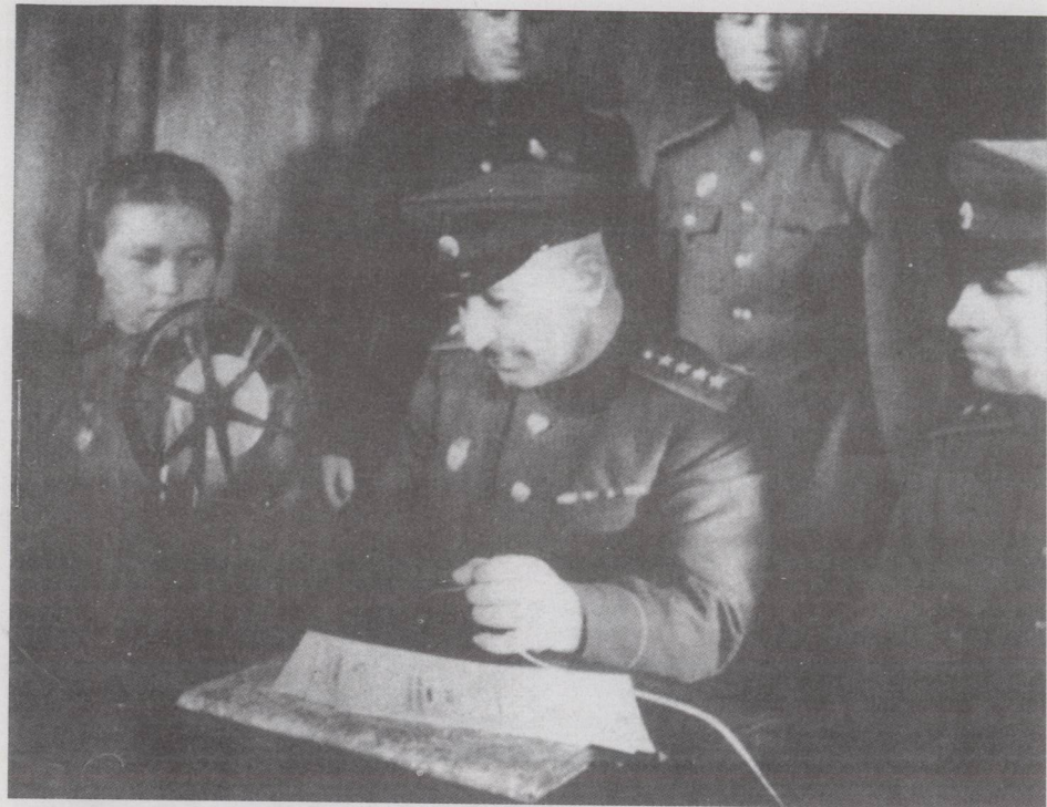
巴格拉米扬(中)在方面军司令部阅读电文