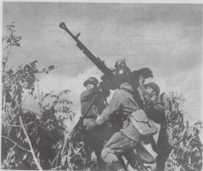
1942年南 方面军，抗击 空袭。