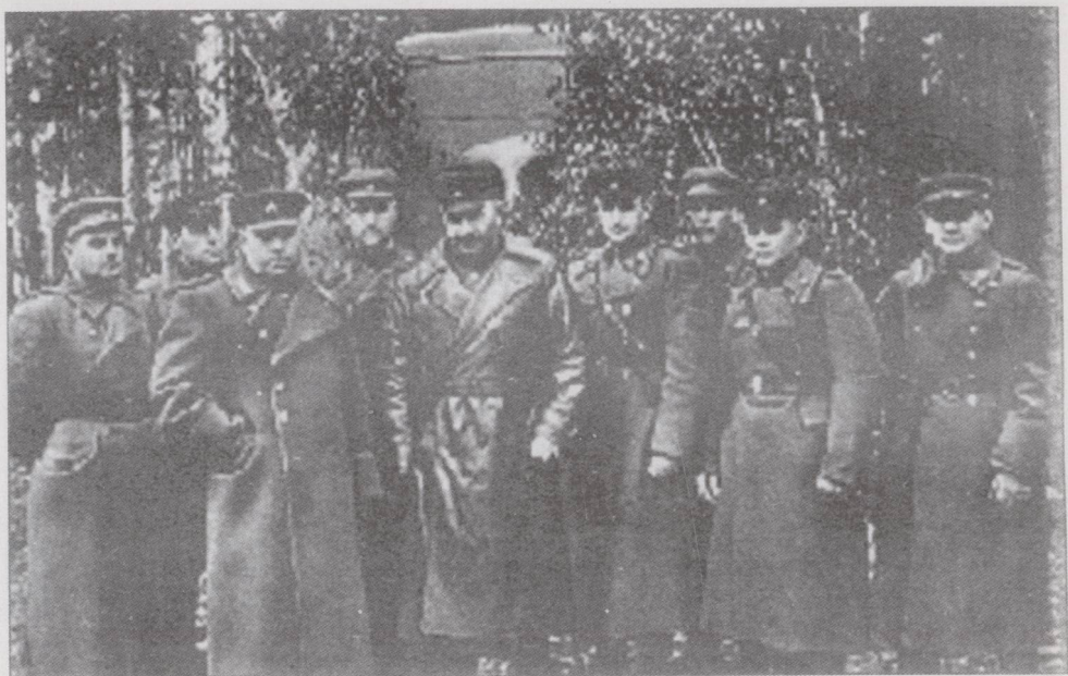
1944年巴格拉米扬(前排左2)在东普鲁士战役期间与部分军官在一起。