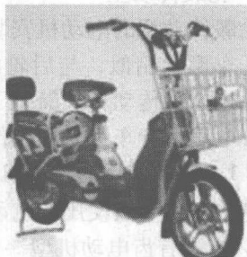
图1-2 多功能型电动自行车的外形