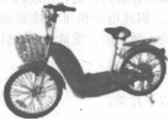
图1-1 标准型电动自行车的外形