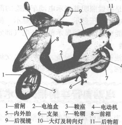
图 1-4 电动自行车结构示意图