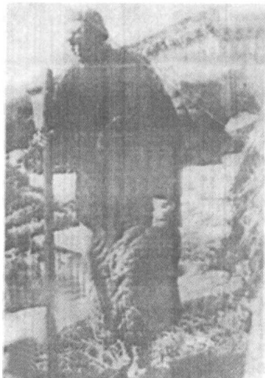
寿镜吾不爱照相,因为他唯一留存于世的晚年照

我才知道做学生是不应该问这些事的,只要读书,因为他是渊博的宿儒 [47] ,决不至于不知道,所谓不知道者,乃是不