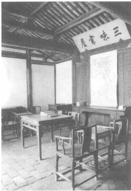
鲁迅少年读书处——三味书屋

“铁如意，指挥倜傥，一座皆惊呢~~~~；金叵罗，颠倒淋漓噫，千杯未醉啍~~~~……” [55]