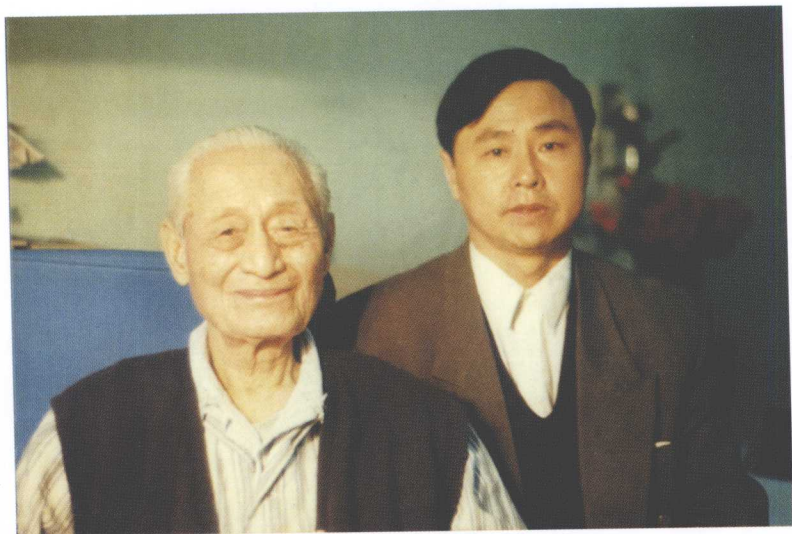
作者1998年在北京医院与赵朴初公合影