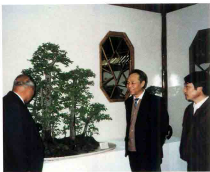
1992年《樵归图》在荷兰国际园艺博览会展出

展览，并屡次获得重要奖项。其代表作有《春野牧歌》、《八骏图》、《小桥流水人家》、《樵归图》、《历尽沧桑》、《烟波图》、《一枝独秀》、《古木清池》等。