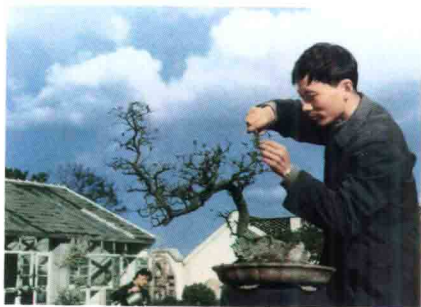
1978年在扬州红园工作

文学、园艺等方面的知识以及英语，并注重与实践的结合。为了师法自然和博采各家之长，还游历了许多名山大川，拜访过孔泰初、朱子安、殷子敏、陆学明、万艷棠等盆景界老前辈，结识了不