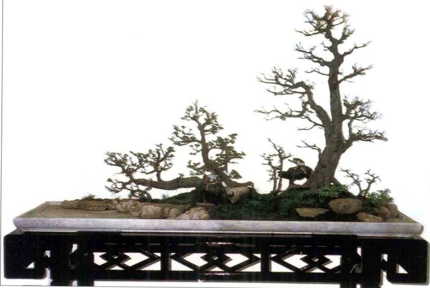
1984年《春野牧歌》在香港展出