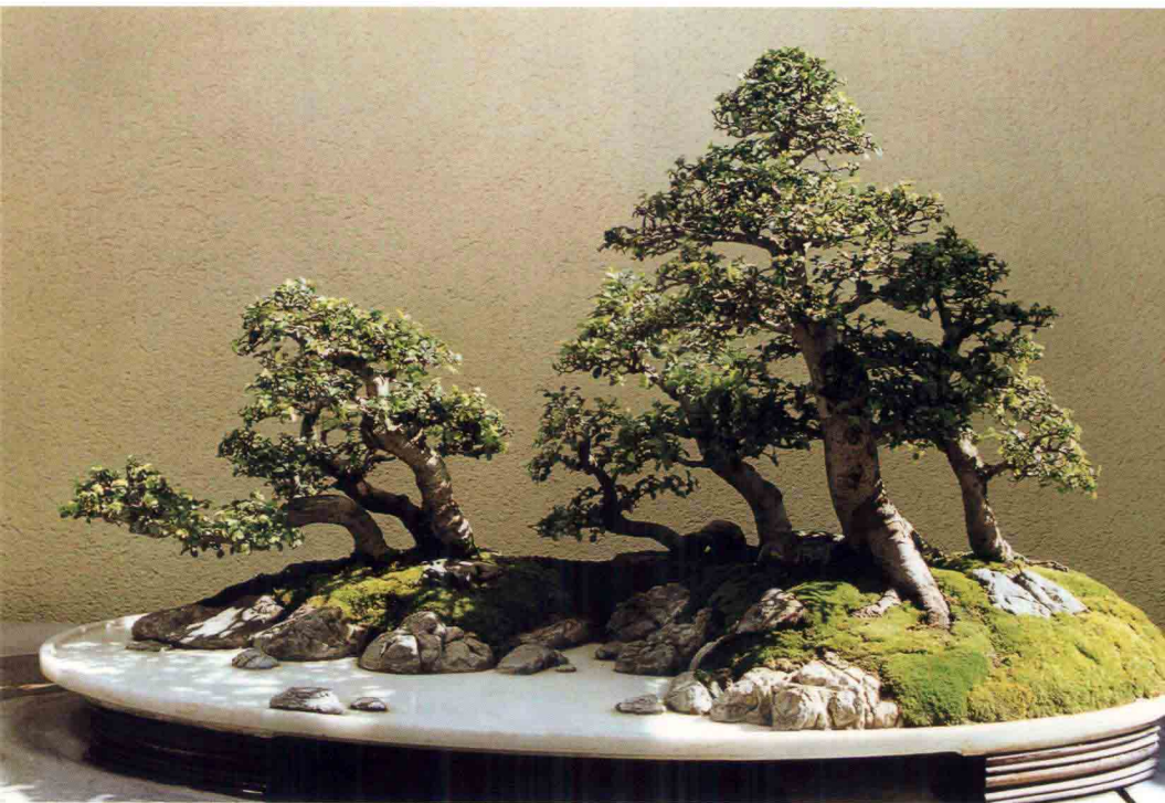
1993年为美国太平洋盆栽博物馆创作的水旱盆景藏品《古林春晓》(榔榆)