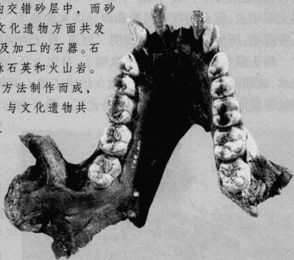
云南禄丰县石灰坝发现的拉玛古猿下颌骨化石

人类的始祖拉玛猿生存于距今800万年前，我国云南开远、小龙潭、禄丰等地已发现拉玛古猿化石。而湖北建始、巴东发现的距今约300万年前的南方古猿化石，则是从猿到人的转变过程中的最后代表。山西芮城西侯渡文化遗址位于黄河中游左岸高出河面约170米的古老阶地上，年代为距今180万年。西侯渡遗址的文化遗物和动物化石集中分布在约1米厚的交错砂层中，而砂层则在早更新世的砂砾层内。文化遗物方面共发现石制品32件，包括石核、石片及加工的石器。石器原料主要为石英岩，少数为脉石英和火山岩。石器采用锤击、砸击和碰砧三种方法制作而成，说明石器工艺达到了一定水平。与文化遗物共生的动物化石有鲤、鳖、鸵鸟及22种哺乳动物。其中有一个保存两段鹿骨的头盖骨，化石中还有一些呈黑、灰和灰绿色的马牙和动物肋骨，化验表明是被烧过的，这些表明西侯渡是人类活动的遗址，西侯渡文化具有一定的进步性质。