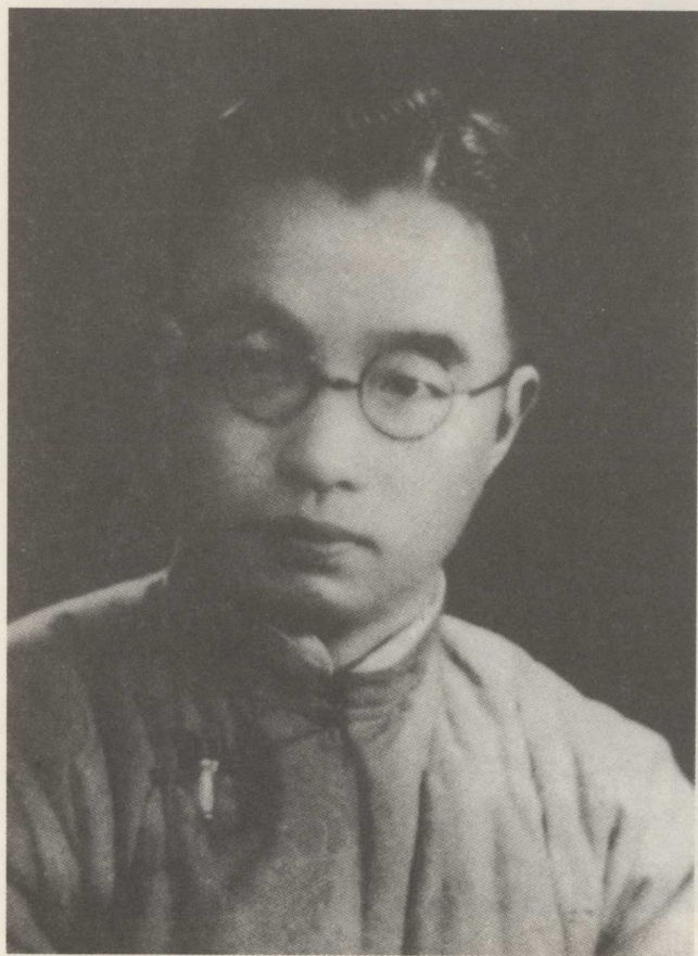
20 世纪 20 年代的朱自清。