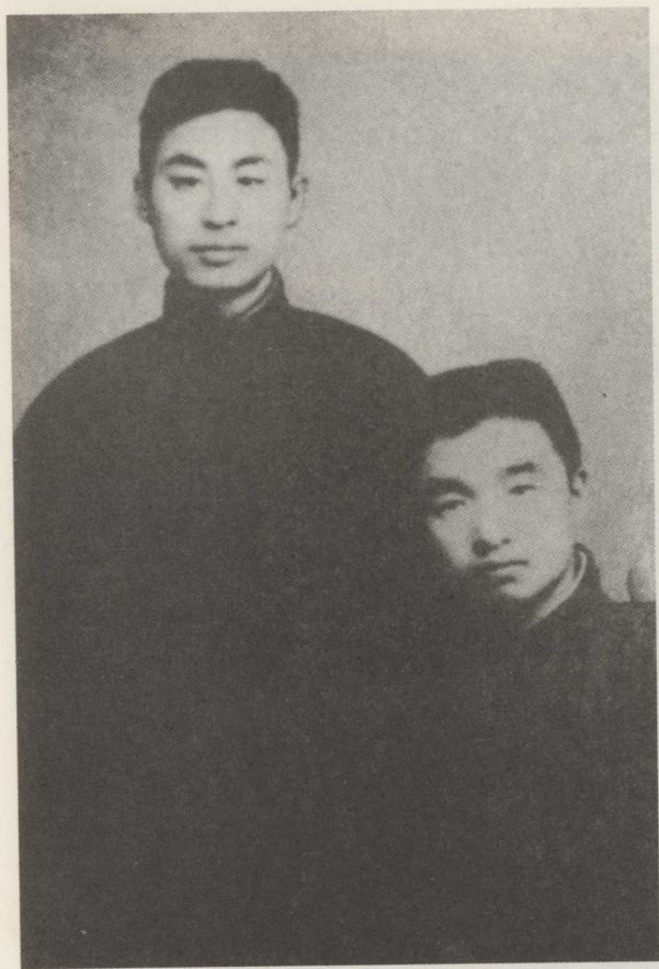
1921年12月31日,朱自清(右)和叶圣陶在杭州。