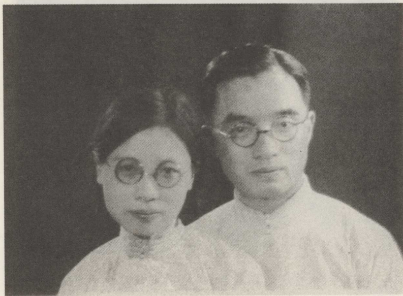
1931年，朱自清与夫人陈竹隐于北京合影。