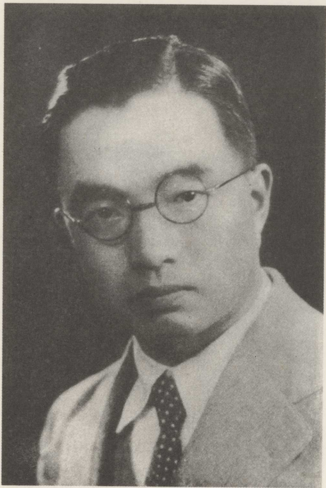
1930年,朱自清在清华大学。