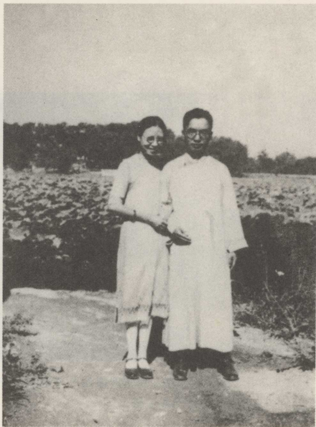
1931年，朱自清和夫人陈竹隐在中南海。