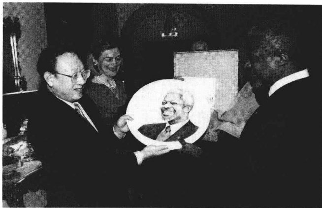
秦华孙大使向安南赠送礼物。

涉中国内政的企图，维护了国家的主权和尊严，鼓舞了发展中国家维护自身利益的斗志。此外，中国自1993年以来连续7次挫败台湾当局收买少数国家向联大提交的所谓“台湾在联合国代表权”提案，不仅沉重打击了台湾当局急欲拓展“国际空间”、加紧分裂祖国活动的