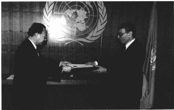
1995 年 6 月 7 日，中国常驻联合国代表秦华孙大使向联合国秘书长加利提交全权证书。

中国作为安理会常任理事国，积极促进消弭热点冲突，支持和参加联合国的维持和平行动，为维护世界和平、谋求公正和合理地解决地区冲突发挥了独特的建设性作用。自 1989 年迄今，中国已先后派出千余人次的军事观察员和工程兵参加了联合国停战监督组织、驻伊拉克—科威特观察团、驻柬埔寨过渡时期权力机构和在东帝汶的维和行动等多项维和工作，并参加联合国“维和待命安排”。在裁军方面，中国政府提出的多项全面、完整、公正、合理的裁军建议，得到了世界许多国家的赞同和支持。中国政府还一贯支持非洲人民的民族独立解放斗争，支持广大发展中国家争取民族独立、反对新老殖民主义和霸权主义的斗争。