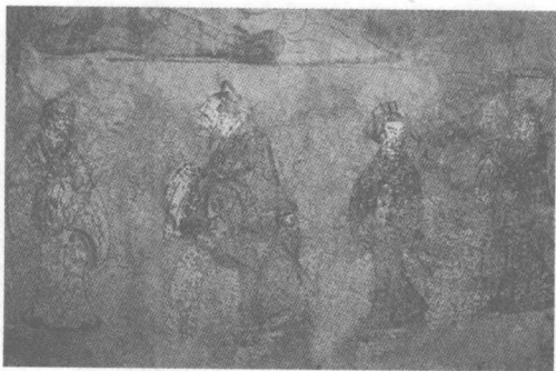
汉代壁画孔子见老子问礼图

孔子平日拘谨惯了，遇到老子这样坦荡的态度，倒是有点向往而出神了起来。不过他赶忙振作心神，道了声谢，吩咐众弟子依着礼数，向老子问候，然后才进入