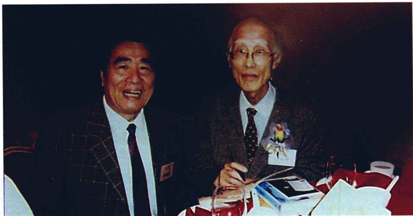
作者与台湾著名诗人余光中合影