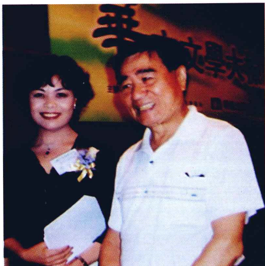
作者与中国作家协会主席铁凝合影