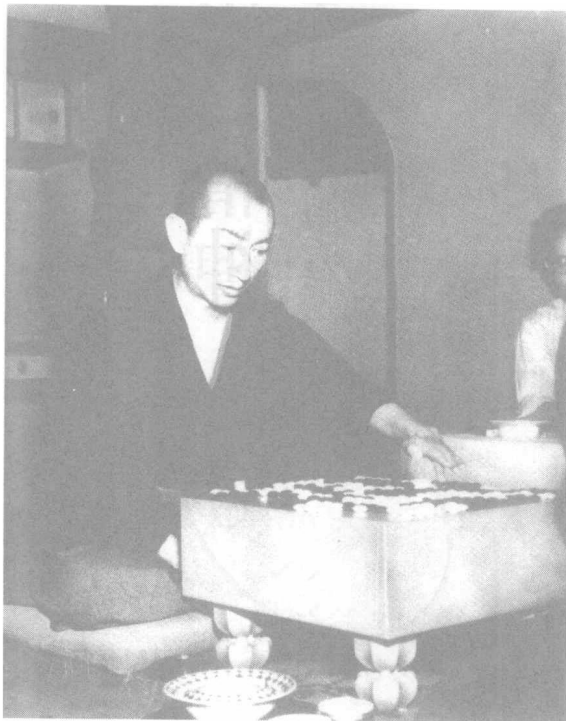
年轻时代的吴清源先生，1931年。