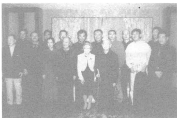
中国电影界欢迎吴清源先生。 2002年11月，北京。