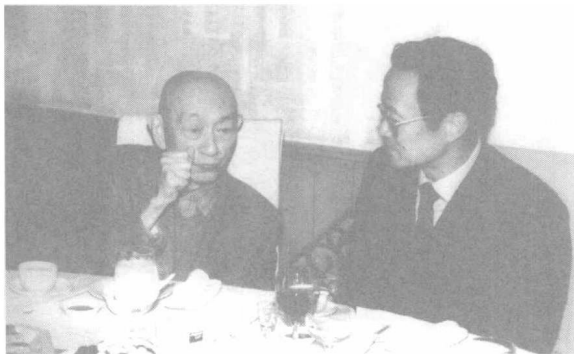
前中国棋院院长陈祖德宴请吴清源先生。2002年11月，北京。