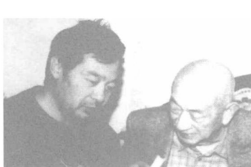
与导演田壮壮讨论电影的创作问题。 2002年11月，北京。