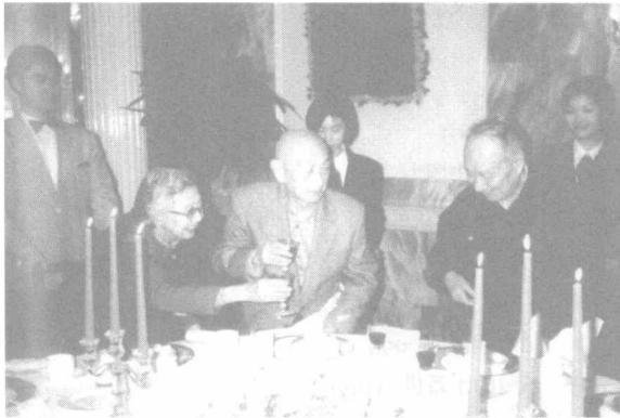
在为吴清源先生举行的88岁生日宴会上。2002年11月，北京。