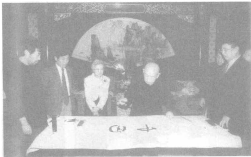
吴清源先生为陈昊苏题词留念。 2002年2月，北京。