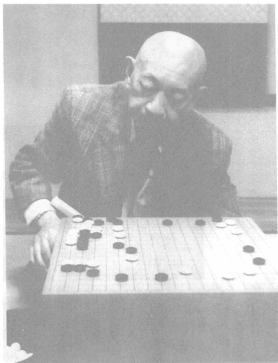
六合之棋——21世纪围棋。