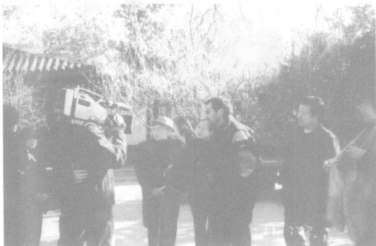
2002年11月在北京拍摄外景。