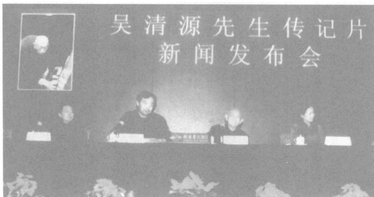
吴清源先生传记片新闻发布会。2002年11月，北京。