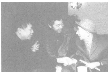
与导演田壮壮（中）、制片人刘小旋欢谈。 2002年11月，北京。