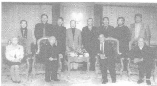
中国国际信托投资公司前董事长王军会见吴清源先生。2002年2月，北京。