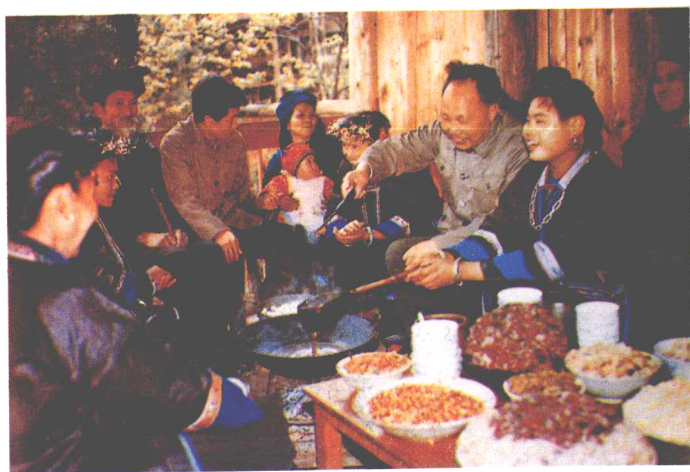
▲三江侗族妇女打油茶迎宾客。(摘自《中国少数民族地区画集丛刊·广西》)