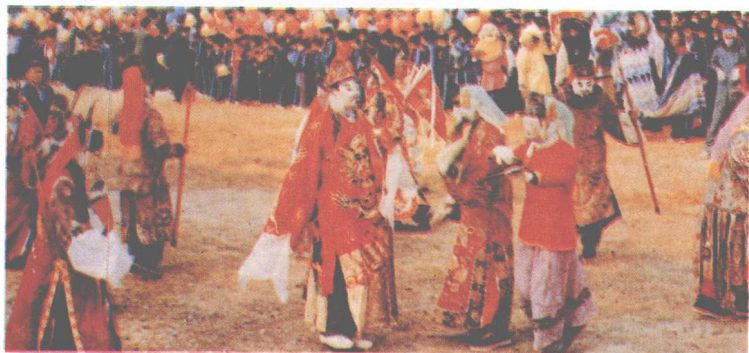
▲毛南族木面舞。(摘自《广西画报》)