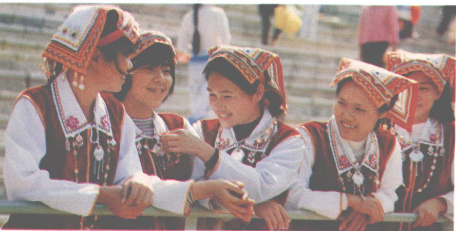
▲全国第四届民运会上的广西仡佬族姑娘。