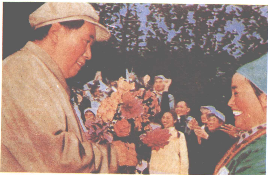
▲1958年,毛主席视察广西时接受侗族女学生吴英花献花。