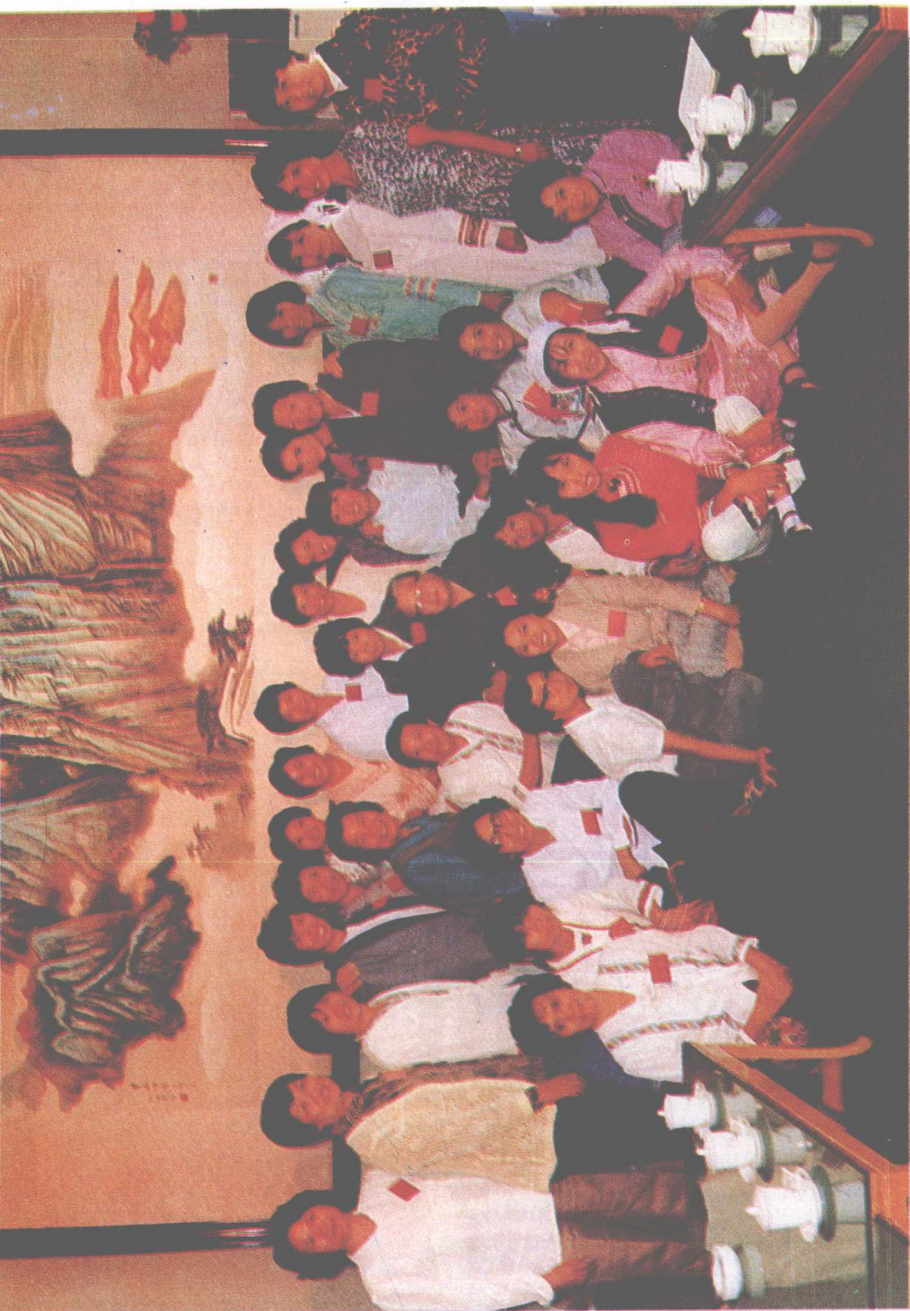
▲1988年，康克清大姐(中)在北京亲切接见出席中国妇女第六次全国代表大会的广西各族代表。