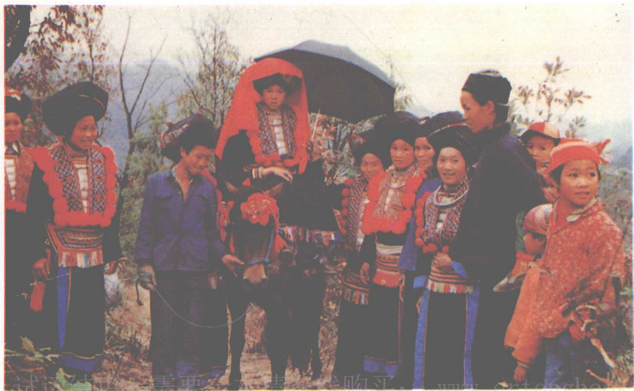
▲田林瑶族结婚 新娘骑马去丰家