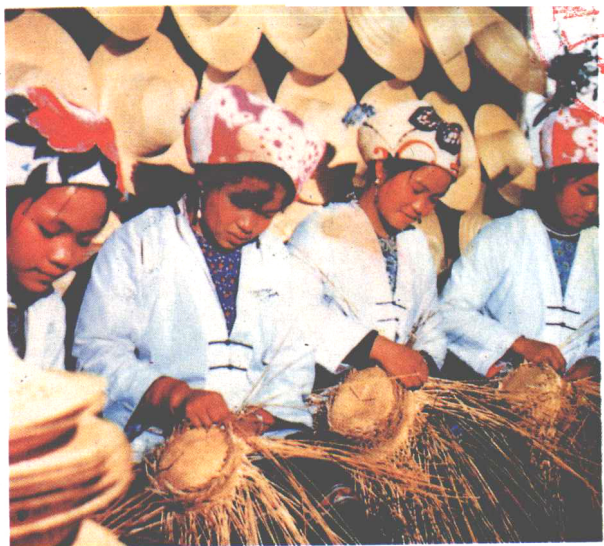
▲龙胜龙脊壮族妇女用稻秆编织草帽。