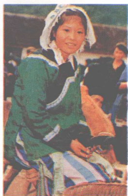
▲圩场上的仡佬族妇女。