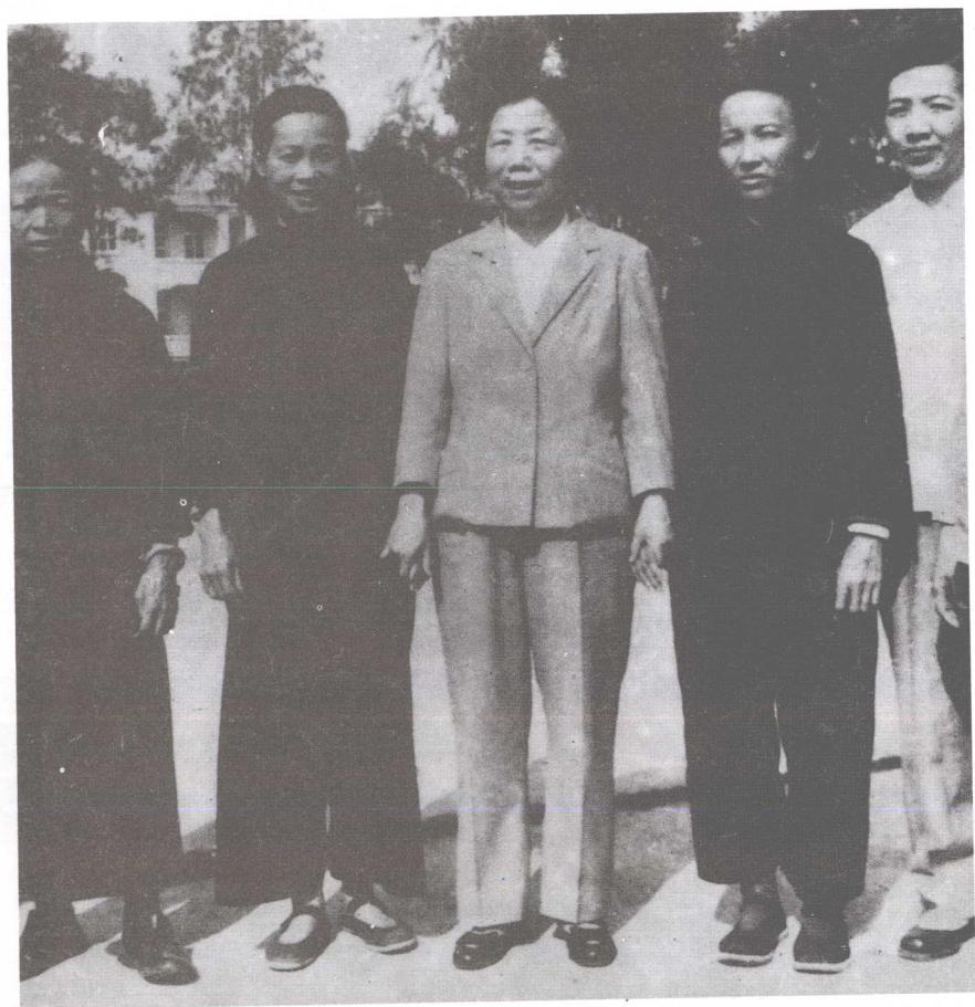
▲1964年，邓颖超大姐(中)在南宁视察时接见广西妇女代表。 右一为赵明坚(壮族)，左二为班玉环(壮族)。