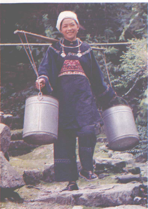
▲南丹水族姑娘在挑水。