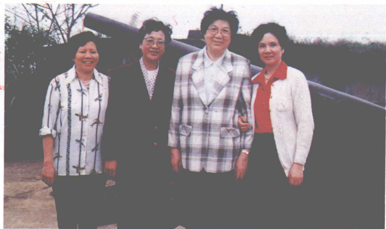
▲1995年，陈慕华副委员长(右二)到广西视察时与广西女干部合影。左二为自治区妇联主席卢玉娟(壮族)；右一为南宁地区行署副专员吴淑兴，左一为南宁地区妇联主席廖鸾凤(壮族)。