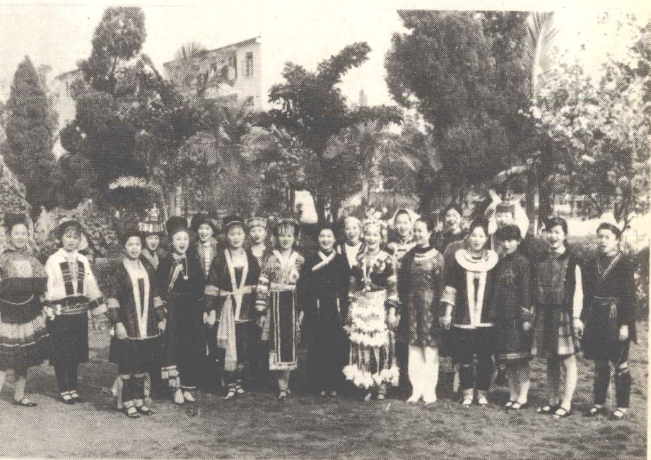
广西各少数民族妇女