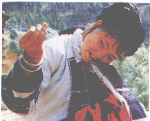
▲那坡彝族妇女在挑花。