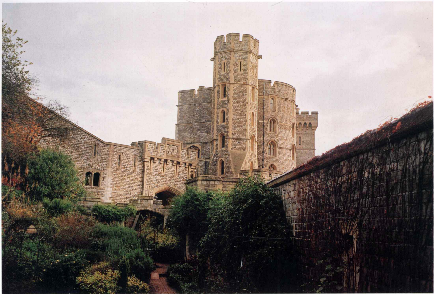
壁垒森严 温莎城堡 2002年11月