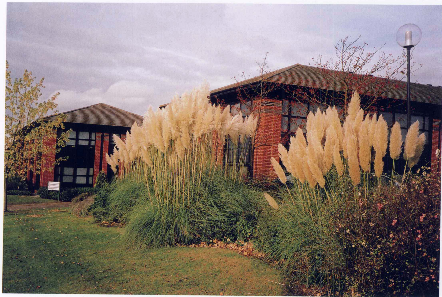
在秋天里怒放 萨瑞大学科技园区 2002年10月