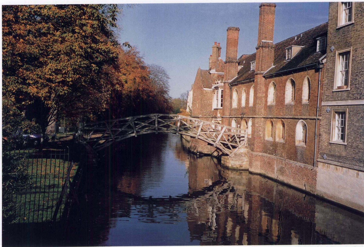
剑桥流水 剑桥大学 2002年11月

小小的河流 小小的木桥 承载着剑桥 辉煌的历史 让无数的学子 感慨万千 流连忘返