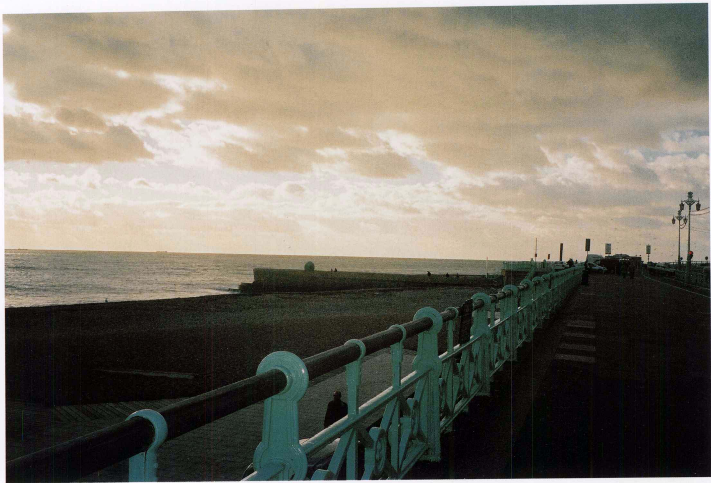
海滨 布莱顿 2002年11月