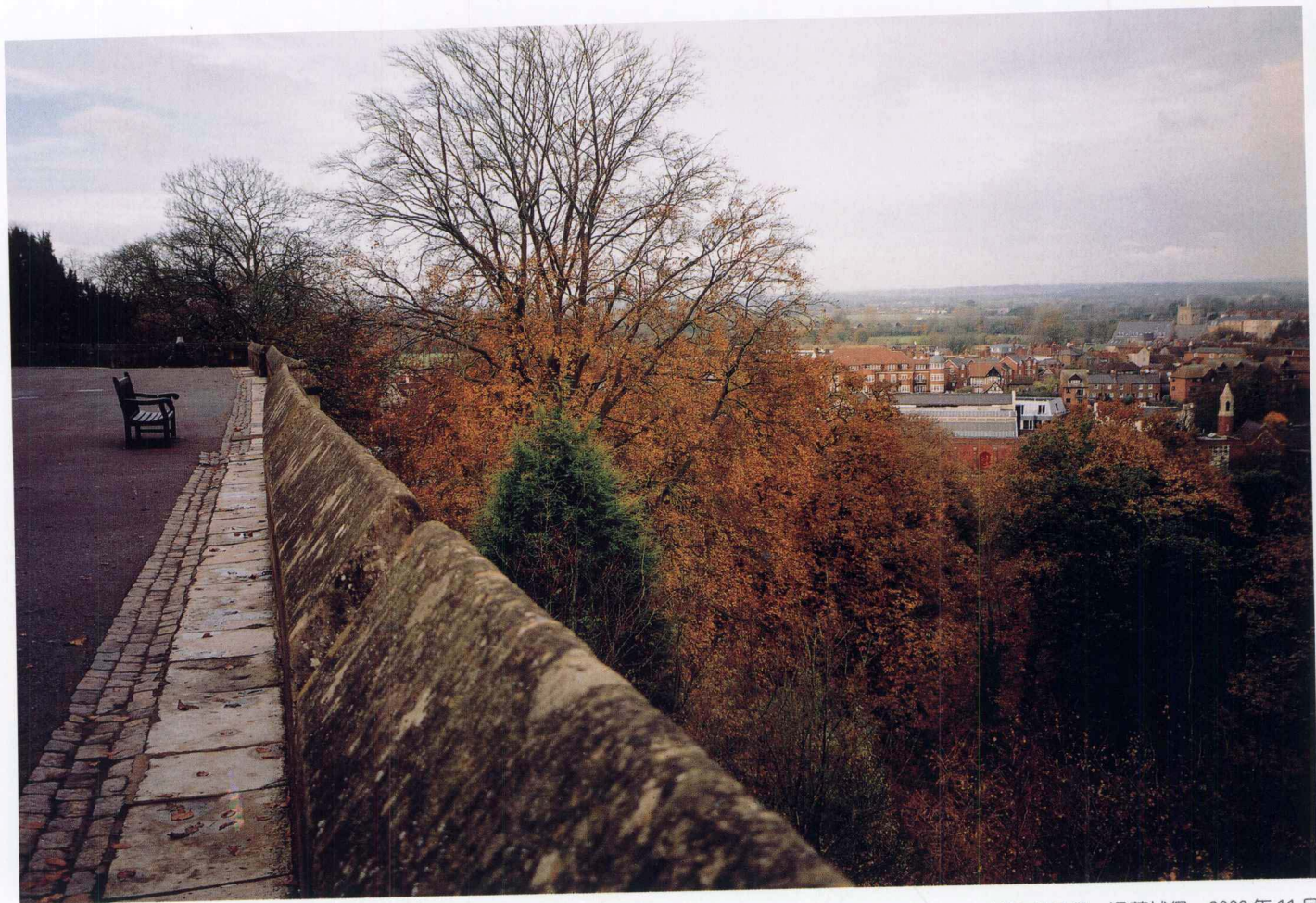
城外的世界 温莎城堡 2002年11月