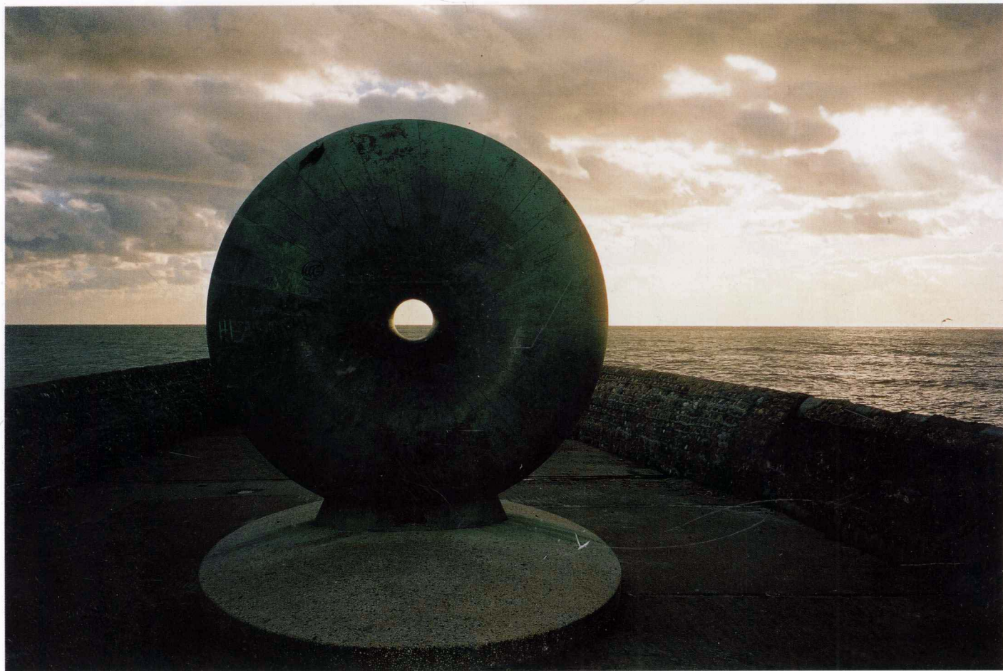
守望 布莱顿 2002年11月