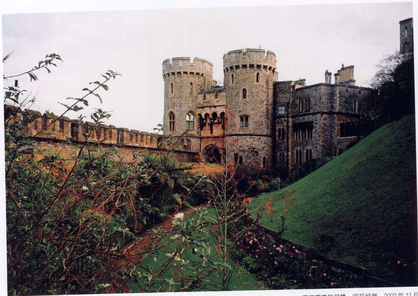
国王寝宫的门楼 温莎城堡 2002年11月