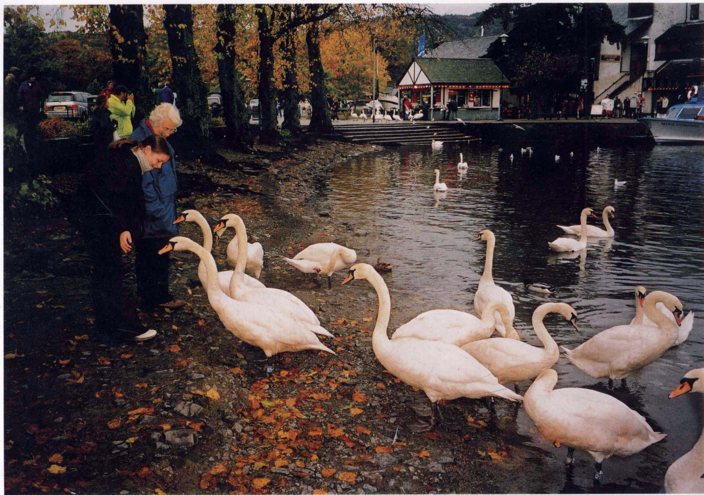
与天鹅对话 卡米尔湖 2002年10月