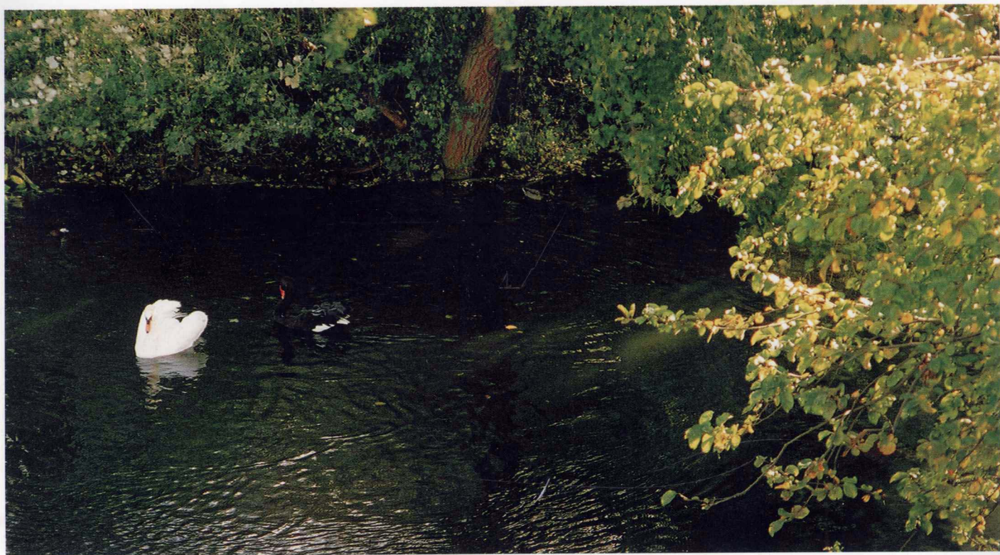
鸳鸯戏水 伦敦 2002年10月