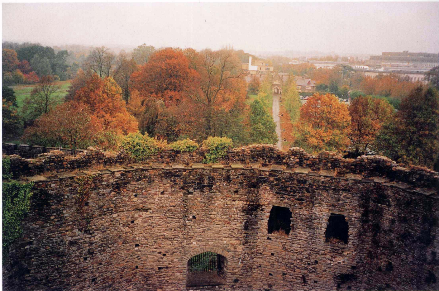
古堡秋影 卡的福 2002年11月