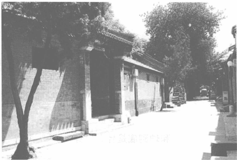
北京市西城区的西西北头条胡同，旧称驴肉胡同，清朝是满洲正红旗居住的地区。和珅就出生在这里，幼年时大多数时间居住在这里。

钮祜禄氏是满洲大姓，有很多支系。满族人的习惯，根据钮祜禄氏分布地区的不同有所区别，和珅家族就属于钮祜禄氏中的英额支系。英额在辽宁省东部长白山地区，原名“英峪峪”，又名“英额峪”，现名“英额门”，是今辽宁省清原满族自治县境内的一个乡镇。此地有一条小河，名叫“英额河”。这里盛产一种野生的小果子，酸甜可口，非常好吃，名叫“英峪秋”，是朝廷贡品。英额是军事、交通要地，地理位置比较重要。