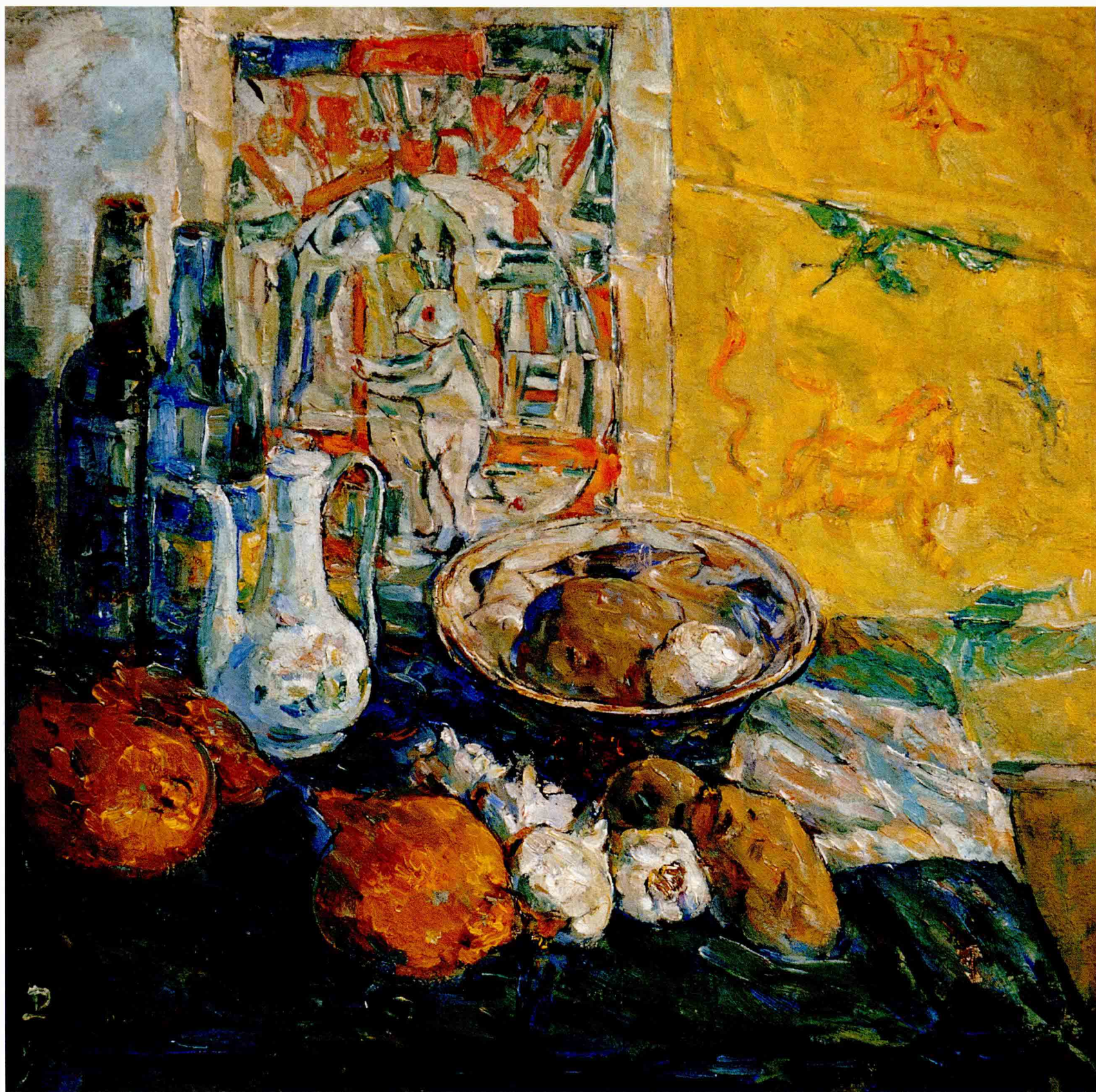
兔儿爷 56cm × 56cm 1962年