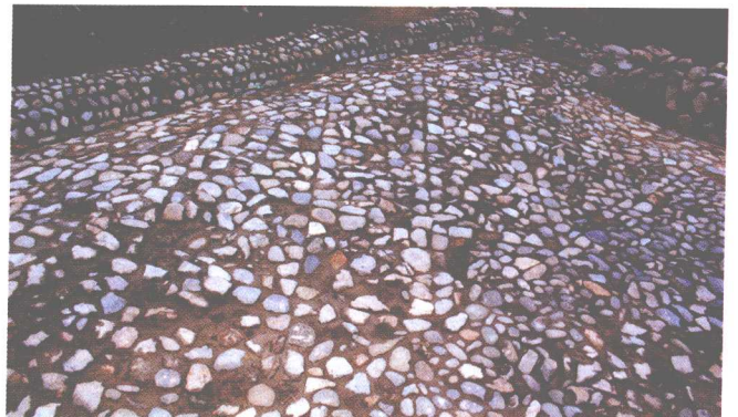
F3院落地面（西北—东南）

属设施，都为我们了解窑炉的营造及结构、研究当时的烧成工艺、甚至推断当时的生产规模等提供了详实的资料。