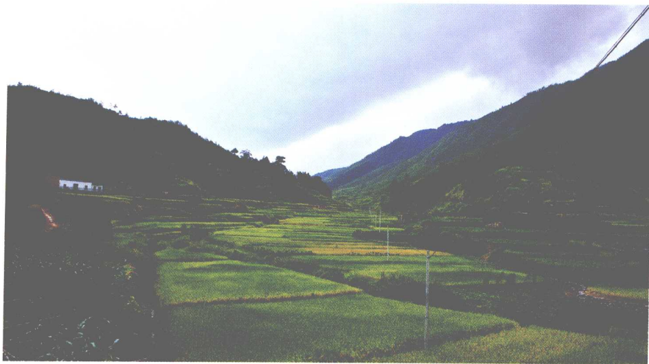
香底，两侧遍布窑址（南—北）