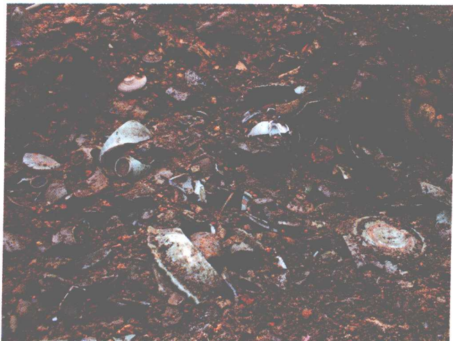
F4永乐官器出土情况