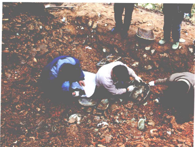
F4永乐官器清理情况