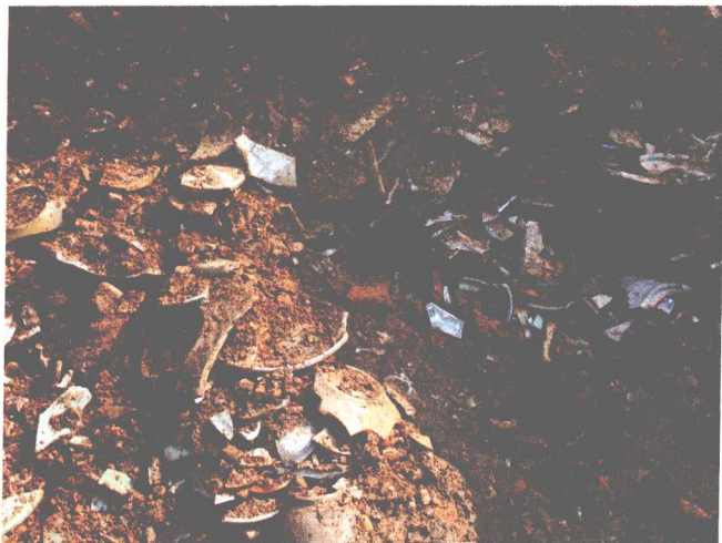
明代一般民窑瓷器出土情况