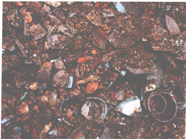
F4永乐官器出土情况