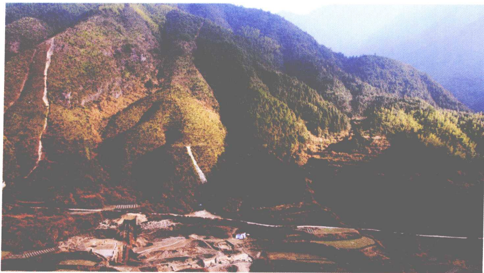
枫洞岩窑址全景（西—东）