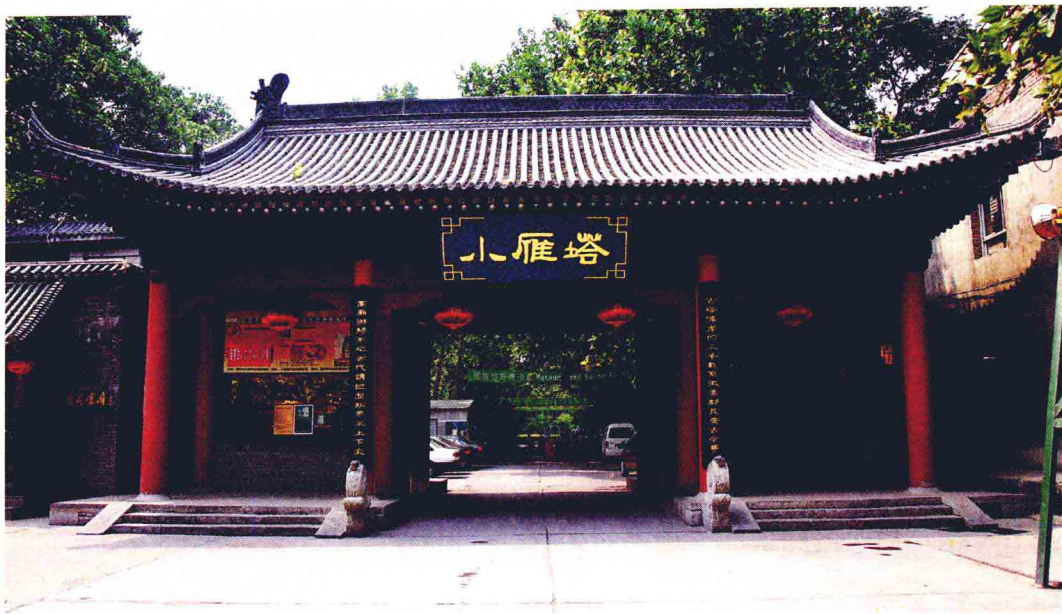
西安博物院北大门

城市发展史一样漫长，历代政府的收藏机构就具有部分博物馆的功能。早在三千年前的西周时期，设在丰京（今西安长安区）的周天子宗庙里就常年摆放、收藏着祭享祖先的青铜器、玉器。汉代因研究儒家经典之风大盛，故对古代典籍收藏十分重视，汉长安城内的