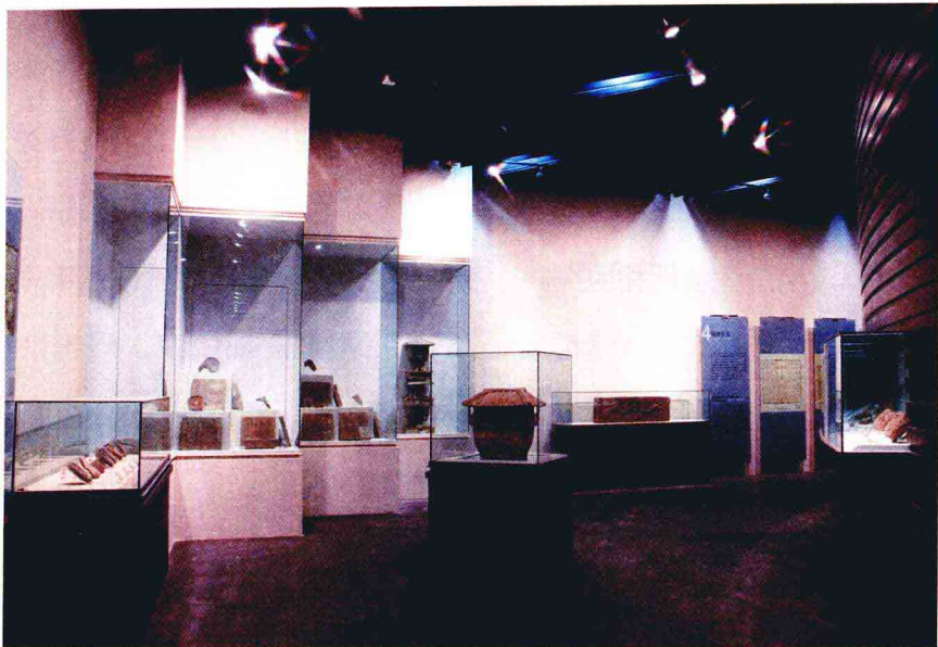
基本陈列——古都西安·千年古都展区