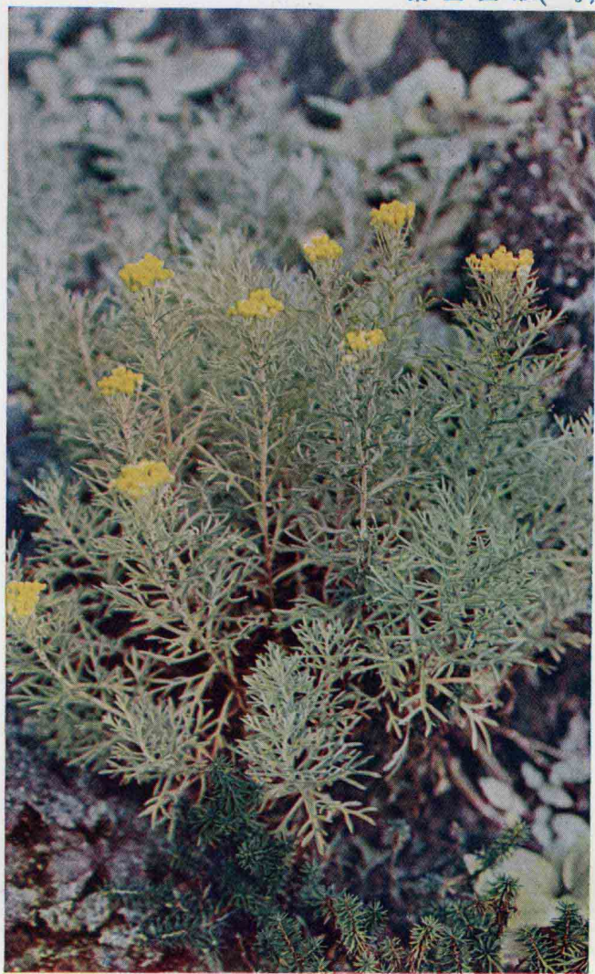
第三圖版( \times \frac{2}{3} )