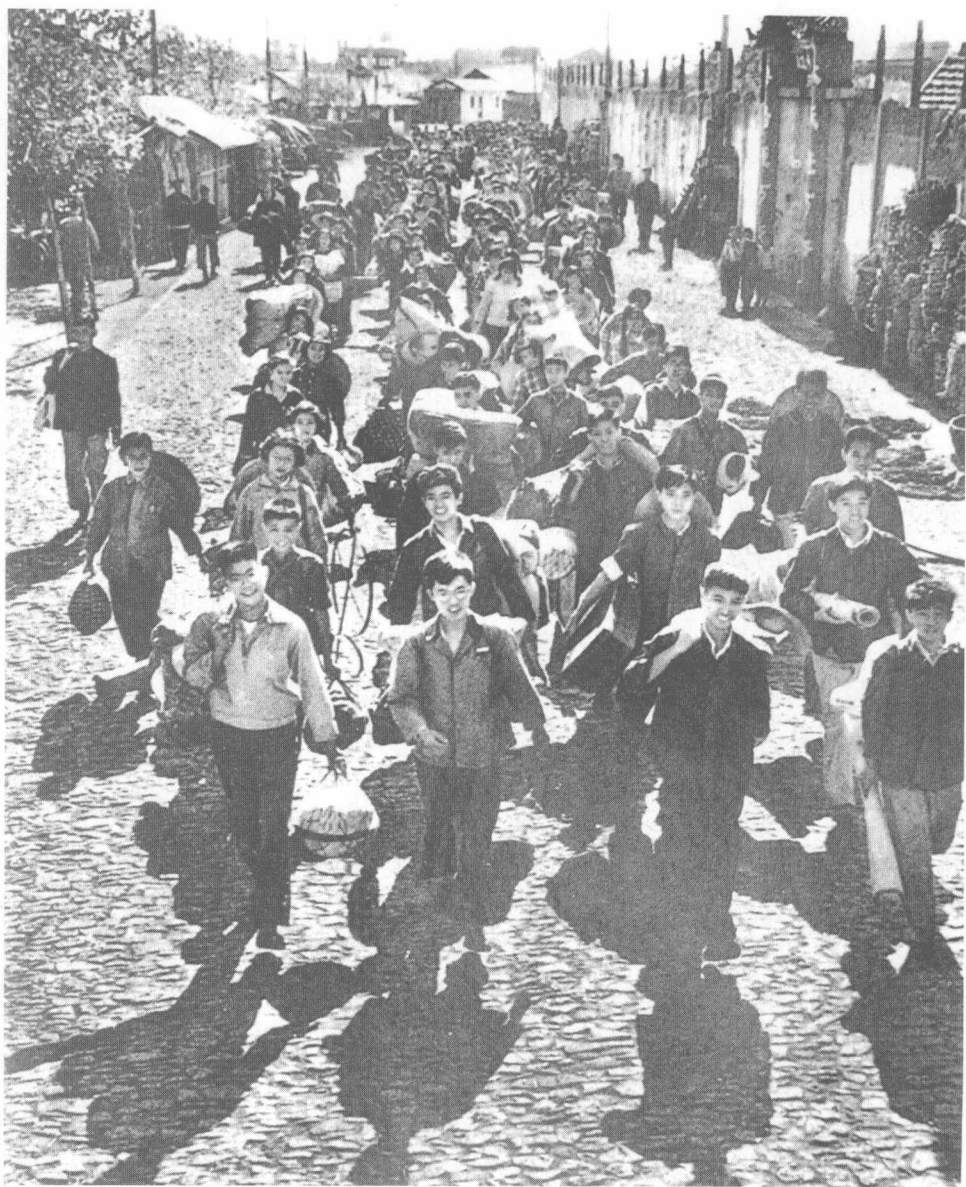
20世纪60年代初，机关干部走出办公室，教师走出学校，学生走出课堂，科学家走出研究室，纷纷来到农村的田间地头，支援农业生产。图为《人民日报》刊载的1960年10月，上海干部、职工分批开赴农业第一线支援农业生产的场景。