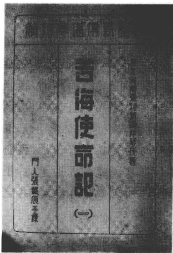
本书初稿油印本(1946年刻写)书影

万劫难得者身，人生最高尚者志，而万世不没者书。既有身，复有志，幸有吾身之暂在。而吾身不显则吾志不达，不显不达再无书以证之，则吾生可泣可歌之行，悲天悯人之志，将随风驰雷掣以去。随风驰雷掣以去，则吾身生如不生，吾志有如不有矣。是知古人著书良非偶然，史迁云云，实先我志。于我书之中，固可知我罪我，而我书果是可传，则吾志不达一时而达千古，吾身不显当世而显万世。又可知书为人精神之永久照片，书为人百世之身份证明。而求其真能寿世，真能达志，则又莫若医书。而医书中最简、最要，最难透彻，最难玩味者，则又莫若医书中之《伤寒》。