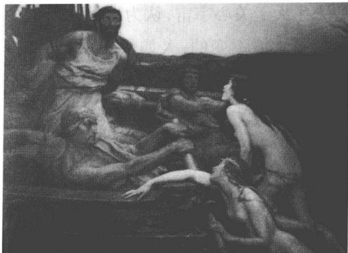
《奥德修斯和塞壬们》