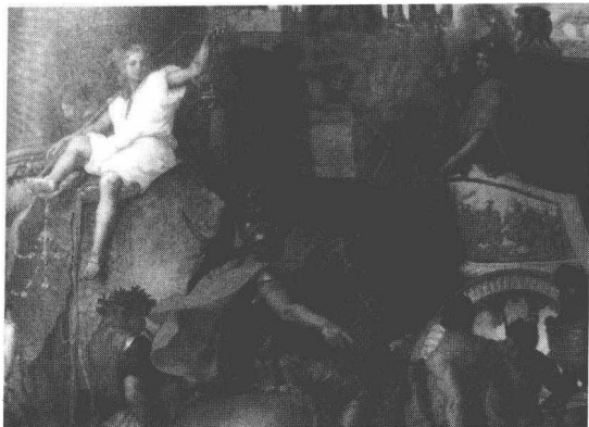
《亚历山大大帝入主巴比伦》 (法)勒布伦(1619—1690)

等地,最后深入印度,却在回程途中于巴比伦英年早逝,享年三十二岁。亚历山大死后不到一周,帝国陷入为期四十年的内乱,公元前275年三位将领三分天下,安提哥那(Antigonus Gonatas)成为马其顿国王,建立安提哥那(Antigonid)王朝,至公元前168年为罗马征服;托勒密(Ptolemy)出任埃及国王;塞流古斯(Seleucus)建立了塞流卡斯(Seleucid)王朝,版图由小亚细亚至印度。