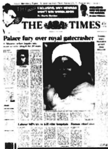
图 1.1 《泰晤士报》版面

坚持认为，任何理由都不能证明由北京所容忍的（如果不是实际纵容的话）、针对日本平民和财产的大众暴力行为是正当的。