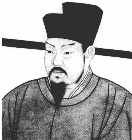
王安石（1021—1086）字介甫，晚号半山，封荆国公，世人又称王荆公，世称临川先生。抚州临川人（现为抚州东乡县上池里洋村），北宋杰出的政治家、思想家、文学家、大诗人、改革家，唐宋古文八大家之一，死后谥号“文”

国 史氏曰：甚矣，知人论世之不易易也。以余所见宋太傅荆国王文公安石，其德量汪然若千顷之陂，其气节岳然若万仞之壁，其学术集九流之粹，其文章起八代之衰，其所设施之事功，适应于时代之要求而救其弊，其良法美意，往往传诸今日莫之能废，其见废者，又大率皆有合于政治之原理，至今东西诸国行之而有效者也。呜呼！皋夔伊周，遐哉邈乎，其详不可得闻，若乃于三代下求完人，惟公庶足以当之矣。悠悠千禩，间生伟人，此国史之光，而国民所当买丝以绣，铸金以祀也。距公之后，垂千年矣，此千年中，国民之视公何如？吾每读《宋史》，未尝不废书而恸也。