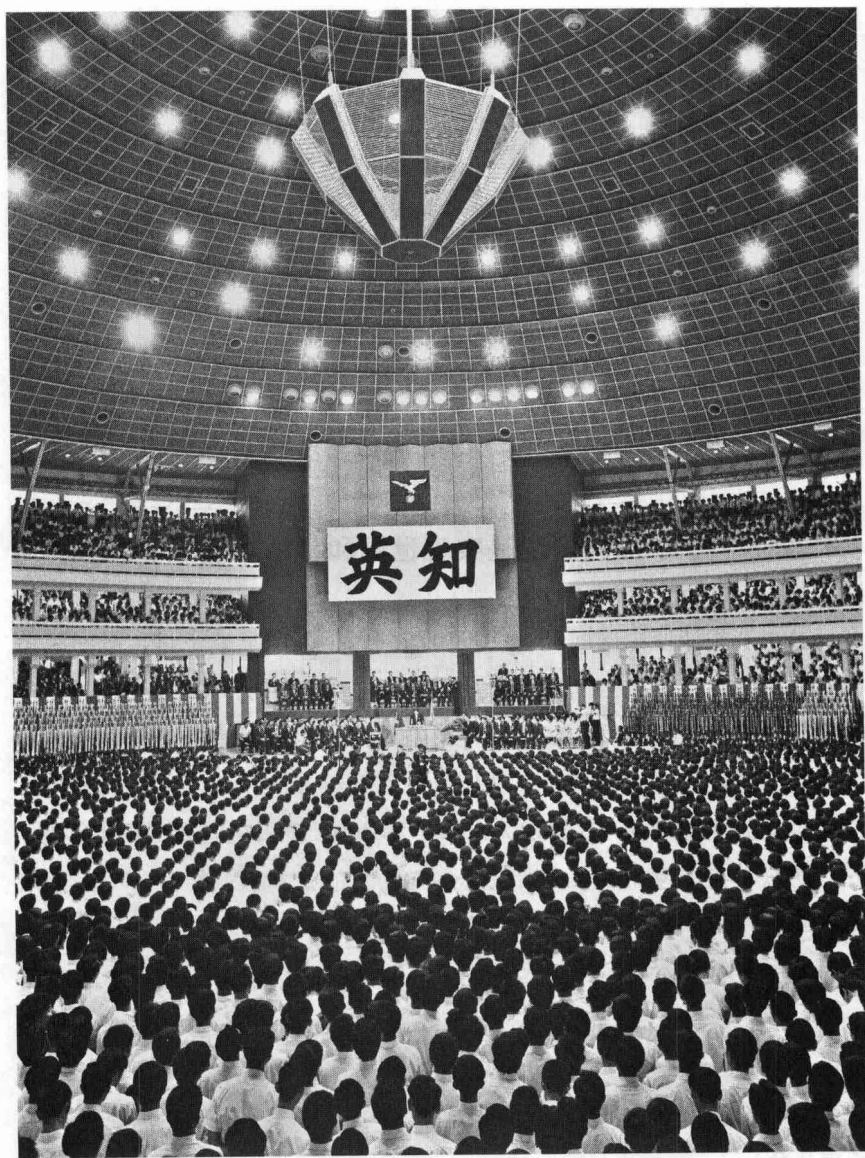
1968年9月8日，时任日本创价学会会长的池田大作在日本东京日本大学讲堂上面对20000名青年学生提出“日中邦交正常化倡言”的演讲现场。