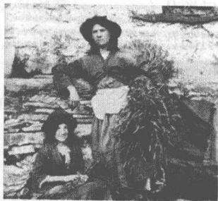
战后欧洲的拾穗女

三四个月的严冬,不知如何过活,因此连衣服也不敢多添,好预备他日不时之用。”就对经济的破坏而言,大战有如一场倾家荡产的大官司,没有赢家:“输家不用说是绞尽脂膏,便赢家也自变成枯腊。”不仅如此,大战暴露出的、且战后依然故我的资本主义社会的尖锐矛盾,也令梁启超忧心忡忡。在德国逗留期间,梁启超就遭遇到柏林全市饭馆罢业,旅馆也不管饭,一行人狼狈万状。对此,梁