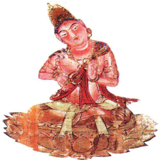
密宗五智佛会大曼荼罗