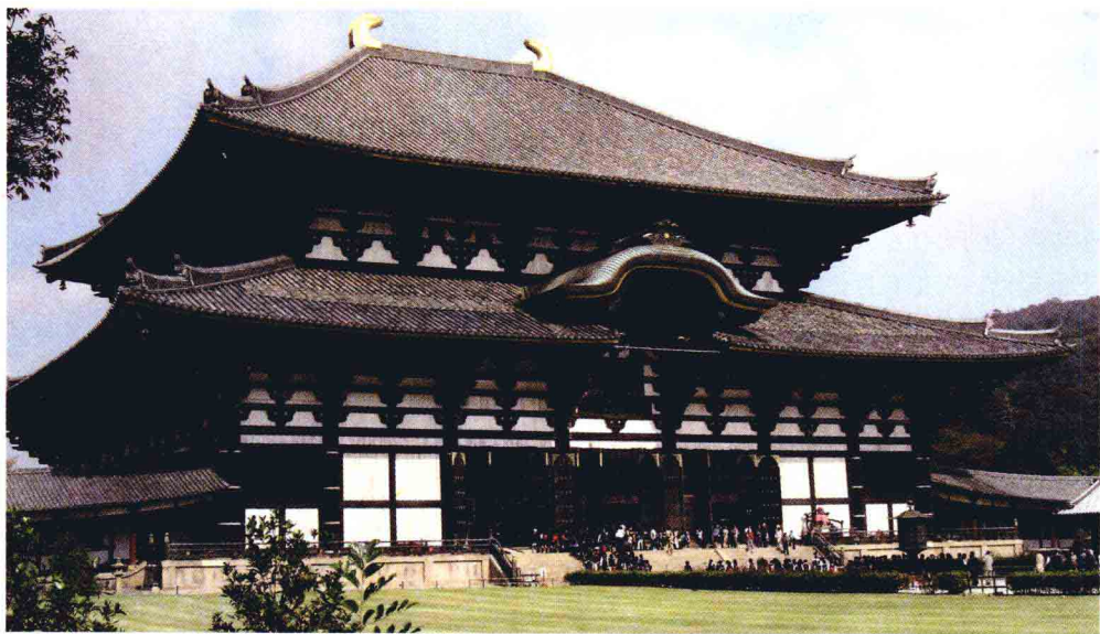
日本奈良东大寺大雄

我们打开曼荼罗，打开经典，观照里面的佛菩萨智慧，此等如来胜行、万佛本誓均是法界成佛者的自内证，以象征及比喻的修辞手法，以“不可说”的观照法门来告知正在修持的无上智慧者，并以“般若”形容之。修持者于刹那间即明白：从此法界的大我观台拿起一朵花，此花非凡夫手上之花，而是具有法界体性智之花。同是一句话，凡夫与法界理解其义并不一样，凡夫之“阿”是“阿”，只是一种声波，但“阿”由法界的佛说出，便可具有大力量。此力量何大之有？常以“大雄”二字来描写此力，称为“大雄力”，可见非一般之“阿”字也。