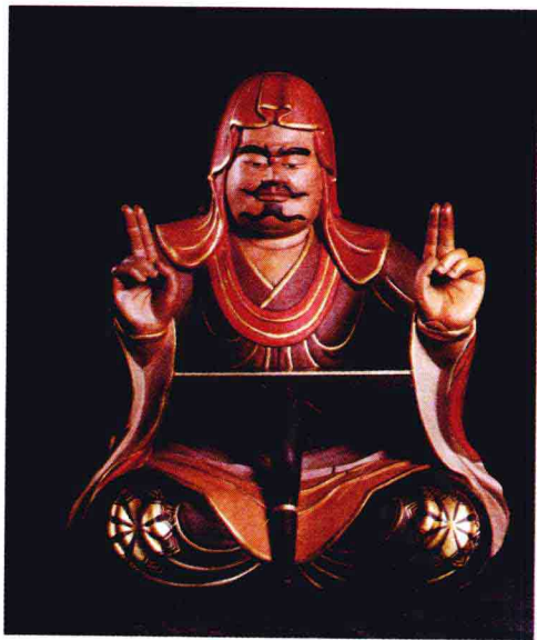
在大染缸中修行的维摩诘居士

菩提。密宗的《理趣经》全称为《大乐金刚真实三摩耶经》，便是阐释此理趣之大经。因此，修密者能细微精妙地观照法界中的缘起万象，不为一切众相所迷，具足般若，未为外境所动，反能翻转迷境为悟境，转移苦难，此乃修密者之大智也。密法不谈“断”，“断”具对立性；密法弟子谈“转”，其智慧非同一般。