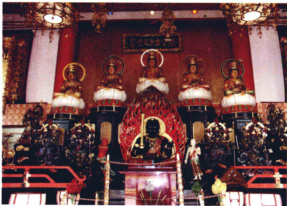
香港修明佛院金堂内的虚空藏菩萨和密宗诸明王像