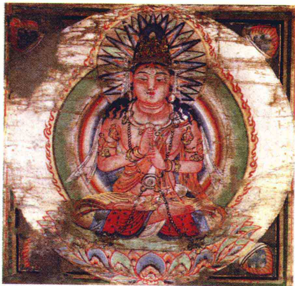
金刚萨埵佛会大曼荼罗

要感谢丈夫成全我修行！”我想，如果丈夫没有包二奶，相信她一生都会迷于情欲和安逸，不到断情绝爱的一天、弥留之际也悟不到无常。世间事无绝对，有失必有得，何必怨怼丈夫。丈夫包二奶也与自己不长进有关。当你丈夫告知你他包二奶之时，正是你最具信心、风华正茂之际，那你便应好好检讨，这是否是自己疏于自励、神采渐失而造成的？当年的爱抚变成今天的怨骂，是否是你将丈夫赶出本有的柔情窝？假如丈夫真的不忠，你也可重新站起来，勇敢离婚，令另一位男士欣赏你，凭你的福气来滋润另一个众生。不要虚伪，当信心回到你的本有时，世间万物皆为你而活，世间万物皆是你曼荼罗之众生，你永远坐在中间当你的大日如来，这个世界的明天等你去创造。