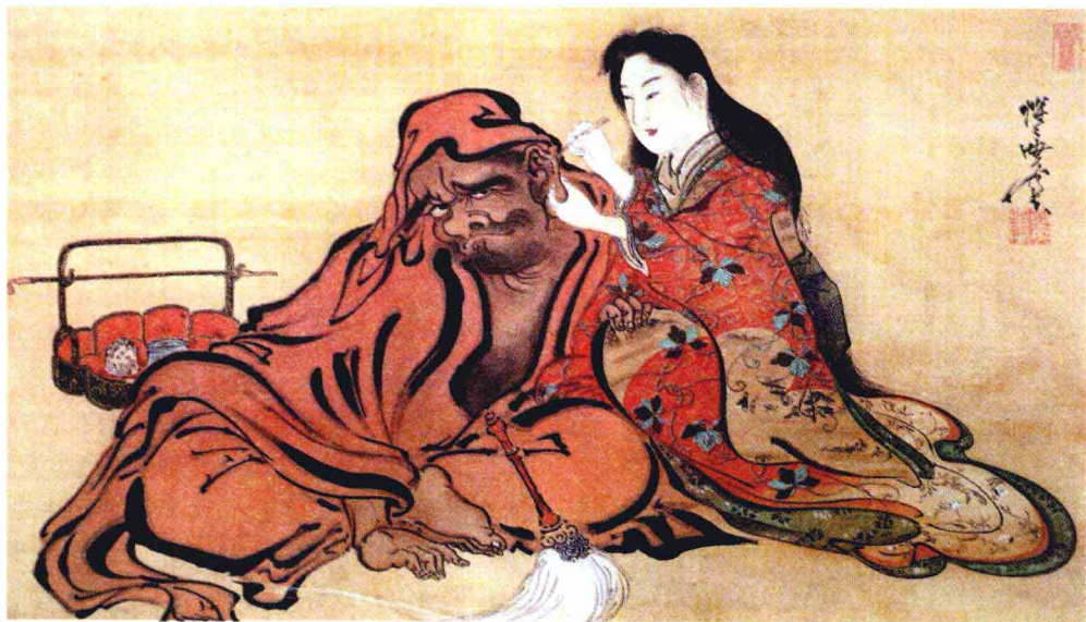
一位禅师七十六岁爱上妓女引发争议