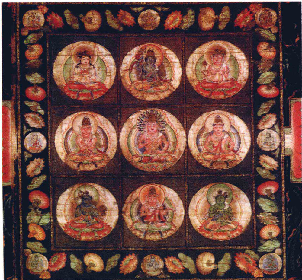
金剛馬尼菩薩壇城