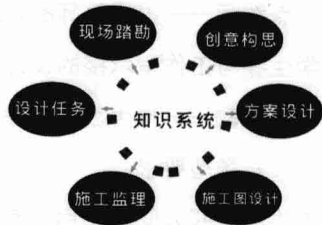
图1-1 构建以工程项目为基础的知识系统

在当下的设计市场中,除居住空间设计由个人完成外,其他室内设计项目,如办公空间、餐饮娱乐空间这一类大型项目,设计工作往往由一个设计团队完成。在教学中,将3~5名学生组建为设计小组——学生可自由结合,也可