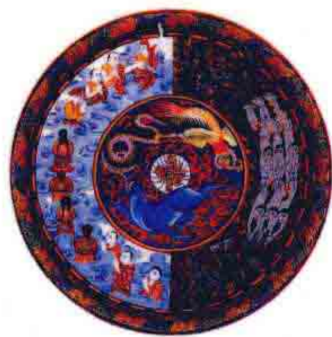
六道轮回 净化贪嗔痴三毒的法宝