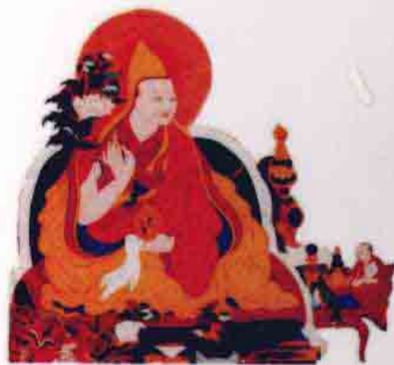
五世达赖 阿旺洛桑嘉措