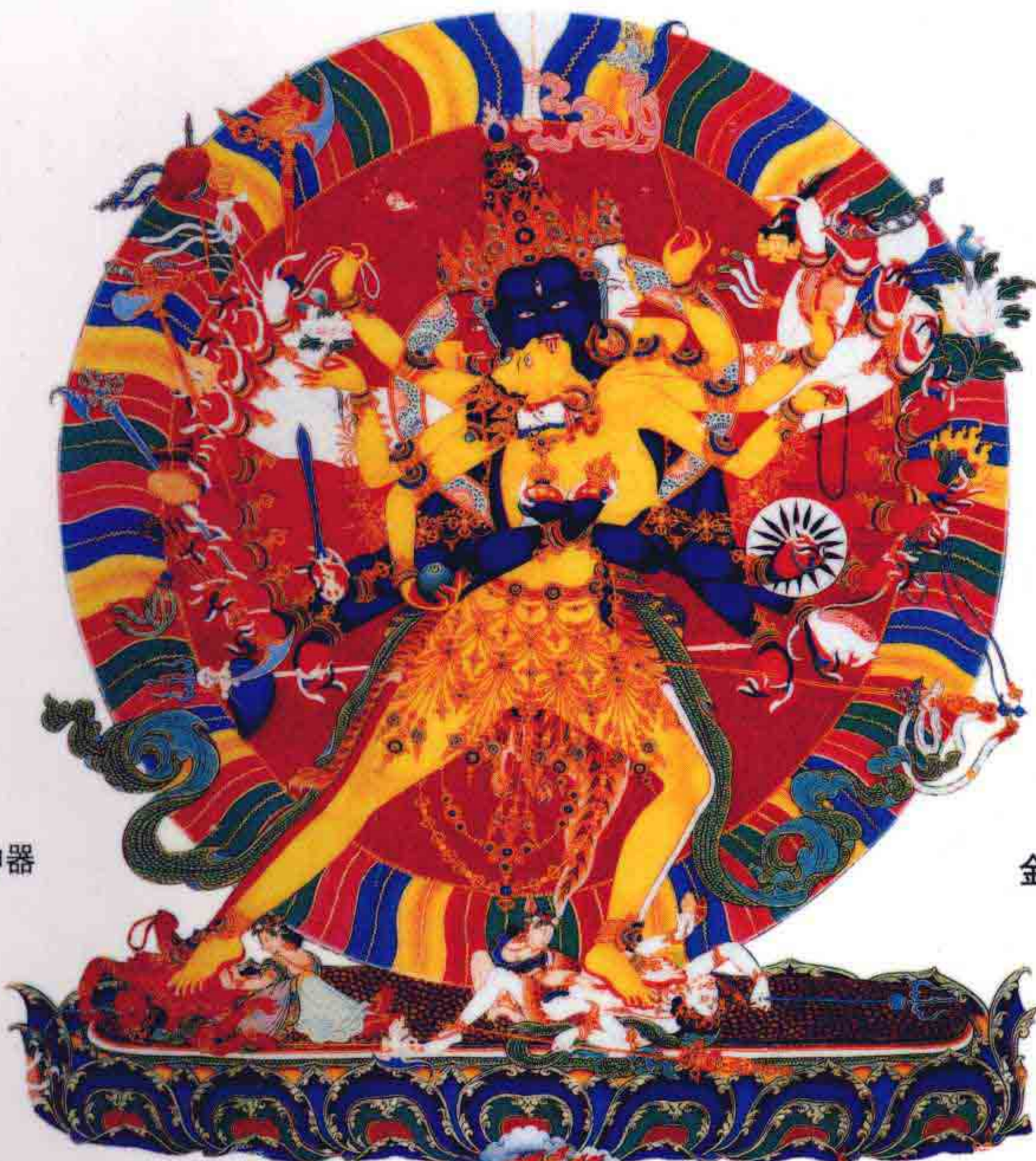
时轮金刚 引导众生脱离迷界的不二续本尊