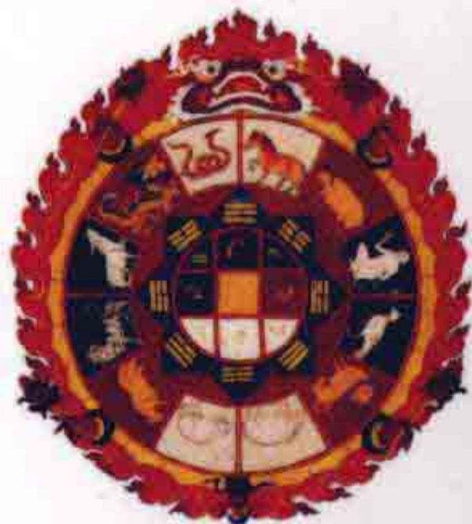
种子字坛城 降妖伏魔、驱邪除恶的神器