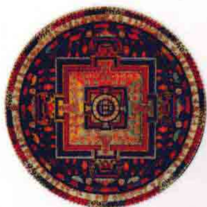
曼荼罗 众生进入佛境的桥梁