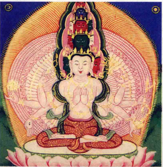
◎ 救度八难十一面观音菩萨