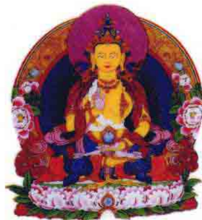
大日如来 施于众生无限佛光加持的佛陀