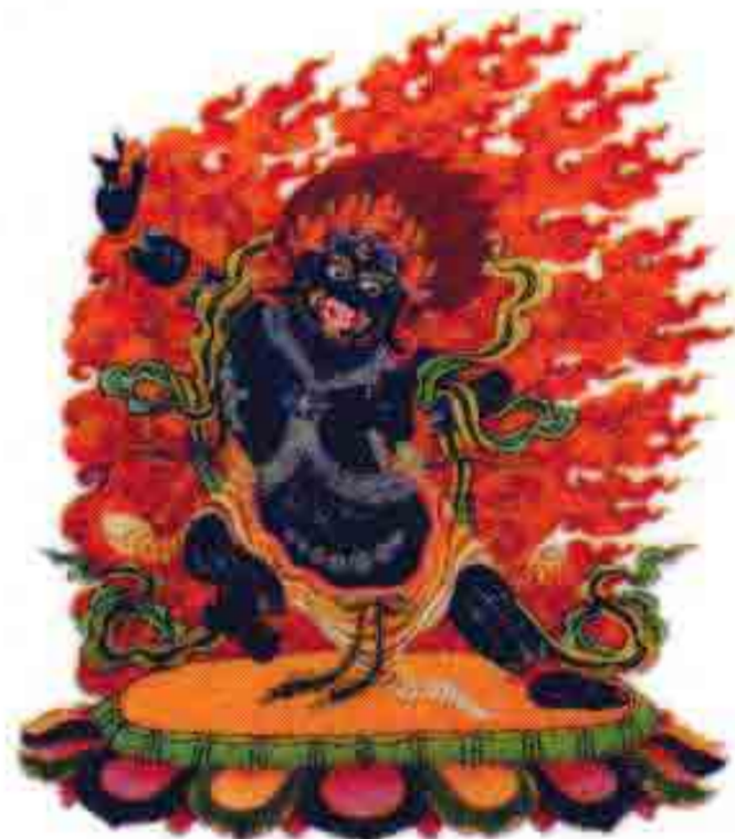
金刚手菩萨 护佑众生远离一切怖畏的佑主