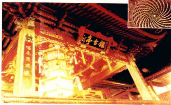
图 1-2 石浦城隍庙的一角(右上角是金顶)

作为一个古镇，石浦当地的宗教、习俗独具特色。1949 年前，就在这 2000 多亩地的小镇上，居然有庙、寺、庵、宫等宗教场所 20 多个。石浦老百姓信奉佛教的风气最盛，也有信道教的，与此同时，非常推崇孔夫子。从北门往上，朝黄埠岭而行，走山路五六分钟就可以到达文昌阁，文昌阁实际上就是为纪念孔夫子而修建的一处小庙宇。石浦人非常推崇孔孟，相信儒教。另外，我家乡的人们还非常推崇戚继光，因为石浦历史上曾经是抗击倭寇的重镇，是著名将领戚继光屯兵的地方，所以有“浙洋中路重镇”