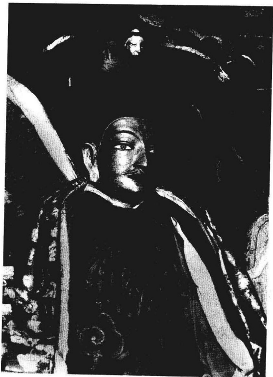
布达拉宫的藏王松赞干布塑像 陈宗烈摄于1987年