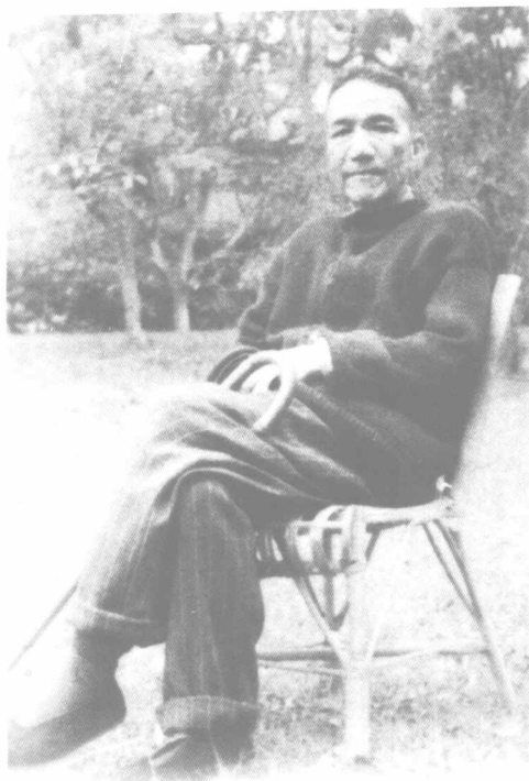
攝於廣州中山大學東南區一號草坪 一九六一年