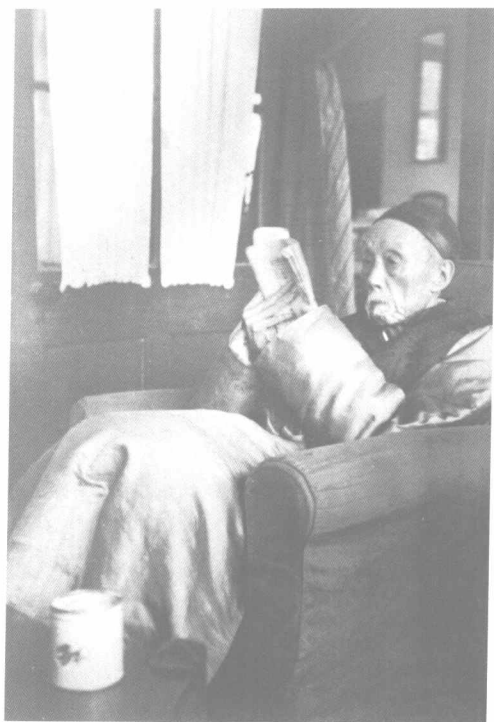
散原老人於北平姚家胡同三號 寓所內