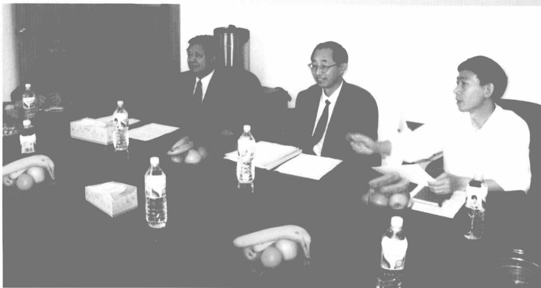
▲ 2005年8月23日，朱佳木同志（右二）在湖南调研地方志工作

2005年8月23日和26日，中国社会科学院副院长、中国地方志指导小组常务副组长朱佳木利用在湖南出席“台湾光复60周年暨两岸关系学术研讨会”和在云南出席“第十二届全国史学理论研讨会”的机会，分别到这两个省的地方志办公室进行调研。朱佳木说，第二轮修志要把质量放在首位，就要把首轮修志的经验总结好。经