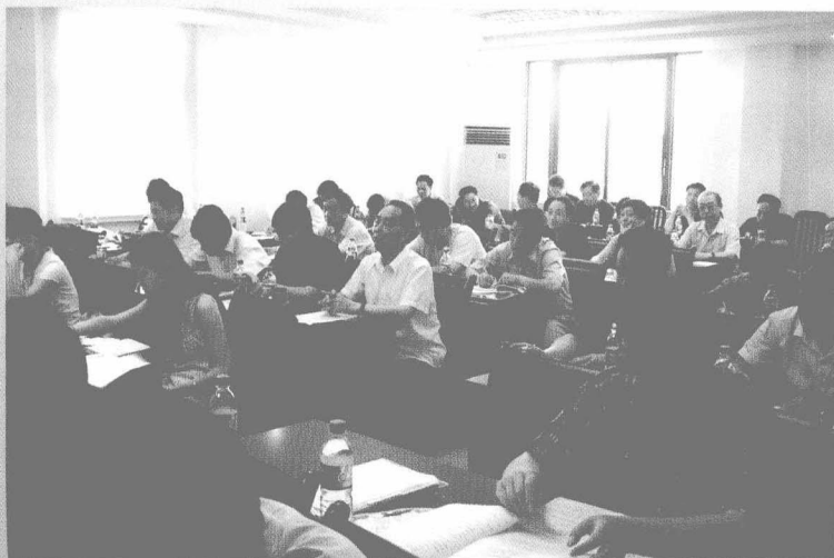
◀ 方志理论与编纂研修班学员听课现场