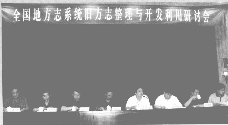
◀ 全国地方志系统旧方志整理与开发利用研讨会大会主席台