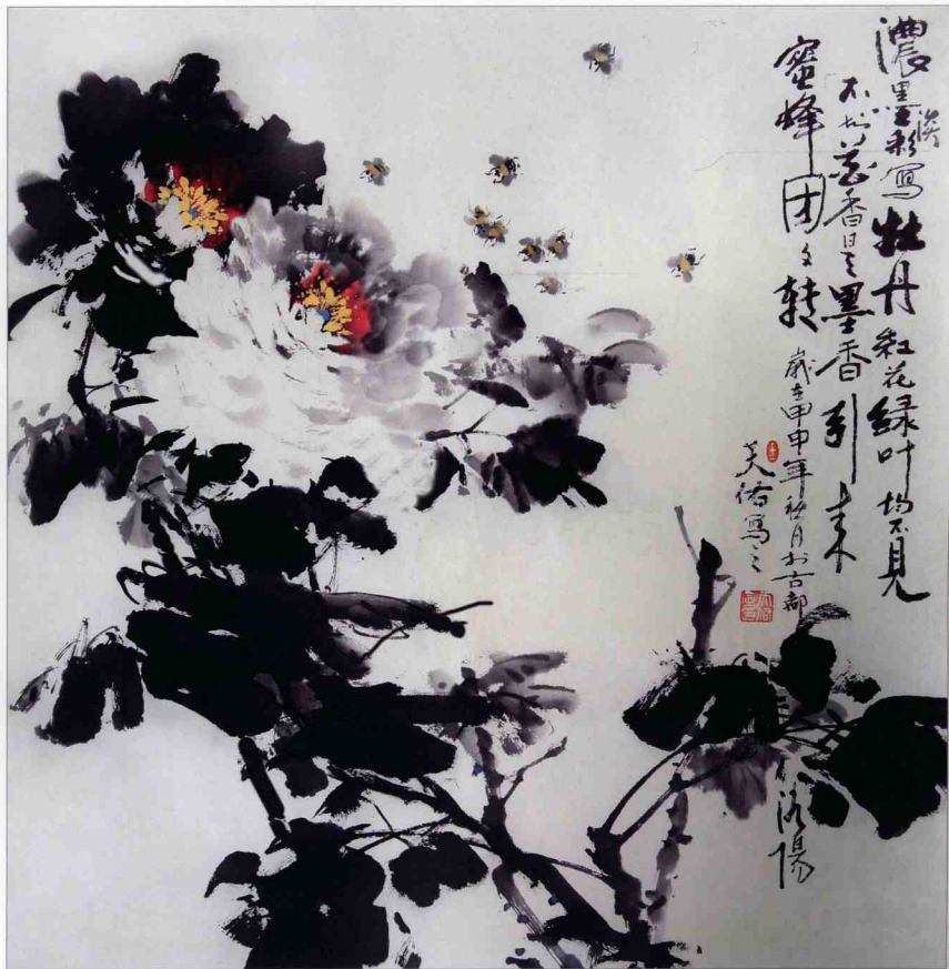
【濃墨淡彩寫牡丹 紅花綠葉均不見 不知花香是墨香 引來蜜蜂團團轉】 68 x 68cm 2004年