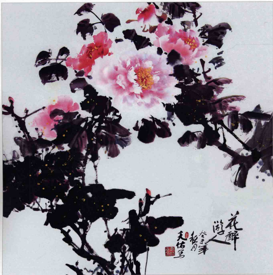
【花醉游人】 68 x 68cm 2003年