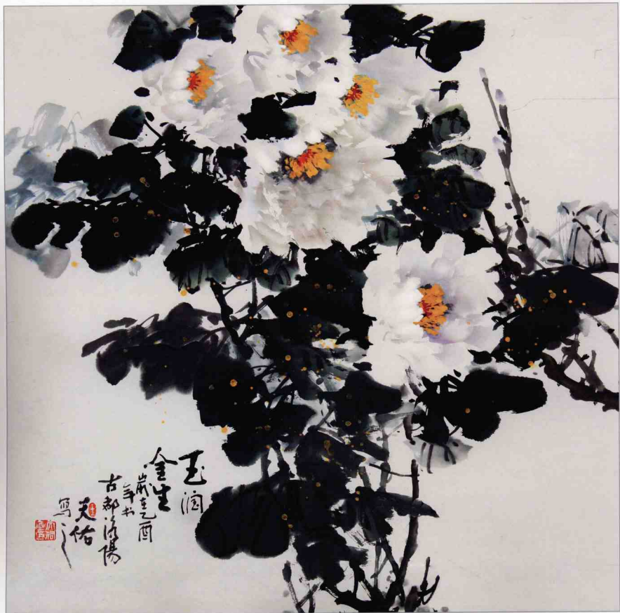
【玉潤金生】 68 x 68cm 2005年