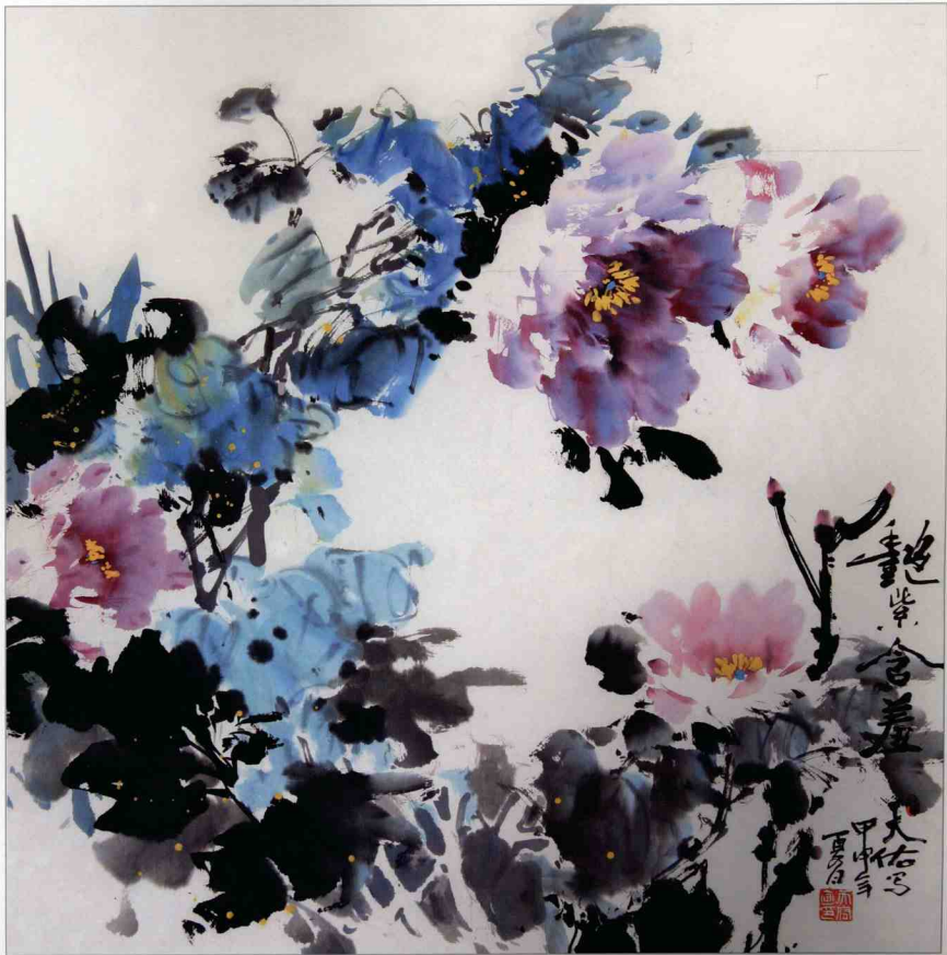
【艷紫含羞】 68 x 68cm 2004年