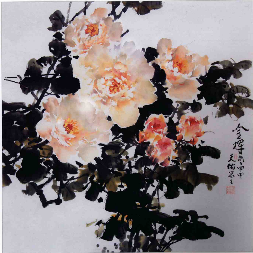
【金 辉】 68 x 68cm 2004 年