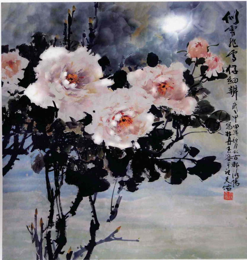
【似雪非雪仔細辨】 68 x 68cm 2004年