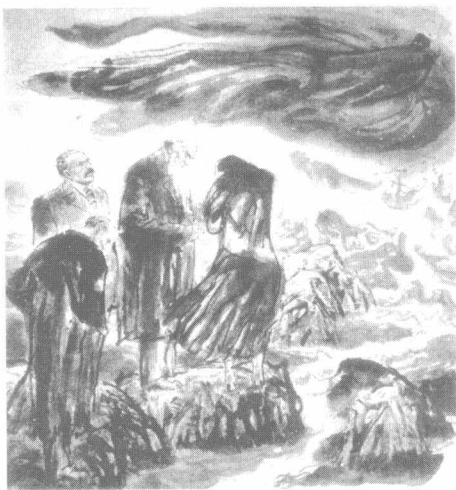
英名长存（中国画）郭全忠 作

成的峭壁悬崖，直插入海。崖壁底部被海水冲刷成千姿百态的岩角和洞穴，海浪冲来，激起绚烂的水柱和浪花。连接陆地的一面，坡势较缓，有一条弯曲的小路供游人登临崖顶。退潮的时候，每每有一些胆大的游客沿这条小路攀援而上。不过，这样做是很冒险的。如果还没有爬上岩顶，海潮又很快卷到，他们可就进退维谷了。