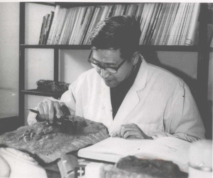
◀ 作者 1983 年在北京自然博物馆化石标本室内研究新发现的恐龙足迹