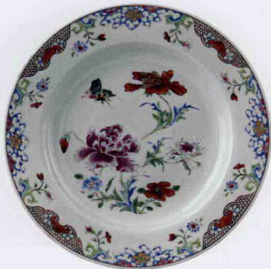
清乾隆粉彩花蝶纹盘 高2.6cm/口径22.8cm/足径12cm

在颜色用法上，广彩除部分原料来自景德镇以外，大部分颜料是广州自制和改配的。从初期的几种增加到十几种，广