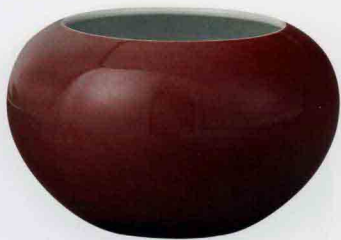
清雍正红釉钵式洗 高13cm/口径13.8cm/足径10.7cm

红釉曾兴盛于明永乐、宣德时期，此后便长期衰落，直到康熙时才重新烧制成功，结束了明代以来近二百年红釉器衰退的局面，雍、乾时红釉再度兴盛。