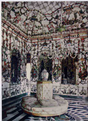
瓷器间 瓷饰组件由雷蒂洛宫陶瓷工场烧制 1760~1765 马德里阿兰霍埃斯离宫

柏林夏洛特堡宫的瓷器陈列室是1701~1713年夏洛特堡宫扩建时增设的，陈列的是普鲁士王室的中国外销瓷器珍藏。