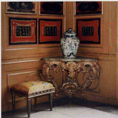
瑞典斯德哥尔摩皇后宫中用中国清代外销瓷器装饰的中国宫 进入17世纪，西欧皇室和宫廷开始兴起收藏中国瓷器之风。

中国瓷器自16世纪以来，一直是国外最畅销的产品，其原因除了当时海上交通发达，还有一个重要原因，就是富有东方民族色彩的瓷器，作为餐饮器具不仅可以代替简陋的木器、陶器和昂贵的金属器，而且原本作为圣物的中国瓷器，已开始在西班牙、葡萄牙、荷兰逐渐演化为奢侈品，成为王公贵族生活的必需品。客厅里，餐桌上，作为珍贵的艺术品，皇家贵族都以摆设中国瓷器来夸耀豪华富贵，出现了居家无华瓷，则不为风雅时尚。国王拥有中国瓷器，既象征权力之尊、国家强大，还象征着修养深厚、生活时尚，于是王侯之间竞相搜集，以在宫殿、厅堂里陈设中国瓷器来显示高贵富有的身份。当时在世界各国上层社会里，无不以珍藏中国瓷器为荣。