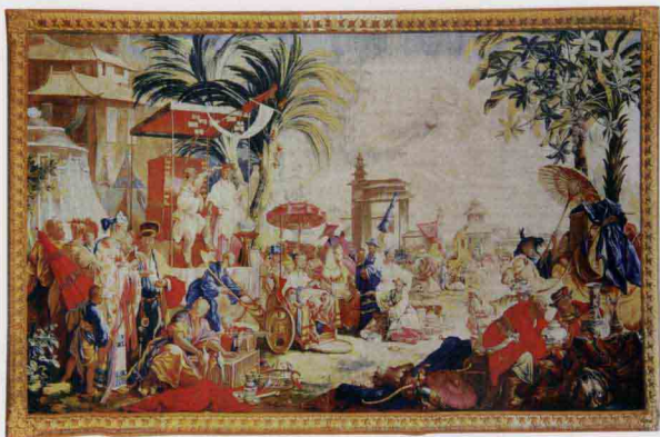
中国市场 [法] 布歇 底稿约创作于1742年 1743～1745年博韦织造所制作为壁毯 绢、毛 363cm×555cm 美国明尼阿波利斯艺术学院

从康熙二十三年（1684）起，清朝的统治在南方稳固后，重新开放对外贸易，允许欧洲各国商船前来广州，中国瓷器恢复大规模出口。中国外销瓷重返欧洲市场后，很快以自己的特色赢得了人们的喜爱。目前欧洲保存的最出色的中国