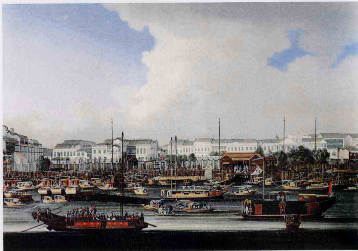
广州商馆区 清(约1840) 佚名 油画·布 纵63.5cm 横88.9cm [美] 安东尼·哈迪藏

康熙二十三年起，清朝的统治在南方稳固后，重新开放对外贸易，允许欧洲各国商船前来广州，中国瓷器恢复大规模出口。