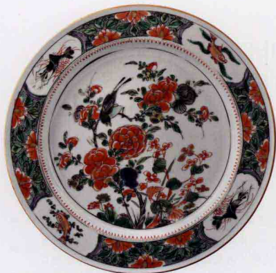
清康熙五彩花鸟纹盘 高1.6cm/口径22.5cm/足径12.8cm