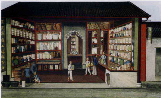
广州“广发号”中国瓷器店。除出售瓷器外，还出售用于装船运输的大木桶 水彩画 画师不详 约1840

正因为是融会中西，清代外销瓷的纹饰内容盛况空前，不但继承了传统纹饰，如：吉祥图案、花卉、翎毛、走兽、山水楼阁、神仙、名士、传说故事、戏剧人物，更有应外商要求而设计的西洋人物、西洋宗教传说、皇家贵族商行军团纹章等纹饰内容。为适应西方迫切了解中国的需要，外销瓷中甚至有描绘中国和欧洲海运码头、商行场景、中国官员、市井百姓衣食住行生活现实、中西交往等的题材。在没有照相机的时代，这些纹饰是极有史学价值的。显而易见，在陶瓷装饰题材内容的丰富性方面，清代外销瓷也是超越历代，超越清代官窑瓷和内销民窑瓷的。