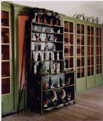
瑞典斯德哥尔摩皇后宫图书馆中摆着中国外销瓷型的漆器柜子。

18世纪欧洲掀起一股“中国热”，中国瓷器特别是青花瓷器，普遍受到欧洲各国人们的喜爱。欧洲人对中国瓷器的喜爱不亚于对奇珍异宝的喜爱，当时欧洲各国王室都以收藏中国瓷器为荣。例如波兰国王约翰三世在维拉努哈宫侧殿，专门陈设中国青花瓷器。西班牙马德里城的皇宫和何朗龙茨宫，设有瓷