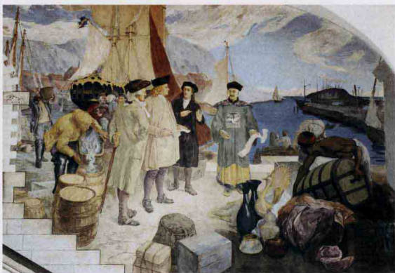
贸易和航运 哥德堡博物馆壁画 1695

广州的艺术家在自己的专业中有相当好的知识才能，是受到外国商人尊敬的。不管外国商人给他们何种西方艺术样式，他们的模仿总是十分优秀。