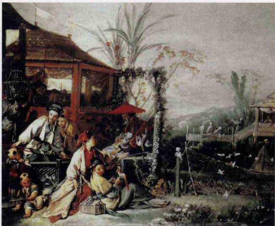
有中国人物的风景