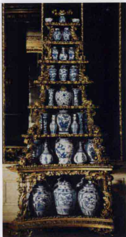
中国外销青花瓷器 17世纪下半叶至18世纪后半叶 柏林夏洛特堡宫陈列室

器陈列室，国王腓力二世收藏的中国瓷器约有3000多件。1753年7月24日，瑞典王后收到国王赠送的特殊生日礼物——建于德罗特宁霍勒姆木结构的中国亭，采用了中国瓷器上的图案来装饰，陈列着王后的景德镇粉彩花瓶等。