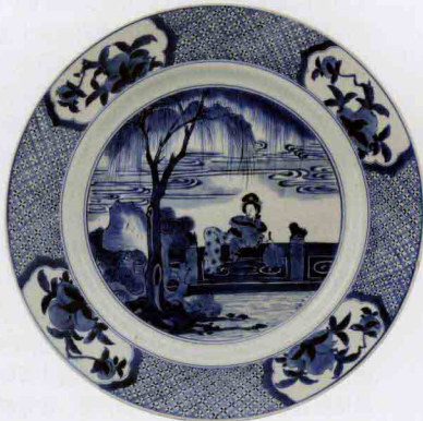
清康熙青花春水照影圆盘 高5.3cm/口径33.7cm/足径19.1cm

清代古彩（五彩）瓷在明代五彩的基础上取得了新的成就。明代五彩用水调彩料，在已经烧成的瓷器釉面上作画，由于烧成后的釉面基本上不吸水，因此水调的彩色很难附着在釉面上，画笔在釉面上运笔稍缓，彩料就会涣散，只能快速运笔