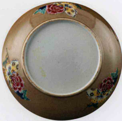
清乾隆浅酱釉粉彩花卉纹盘 高4.6cm/口径26.7cm/足径17cm

清代外销瓷在这样丰富多彩的艺术技法中做足了文章，不但各种陶瓷装饰技法在外销瓷中都达到了充分的发挥，而且在各种技法之间自由搭配组合，产生了大量前所未有的新品种和新形式。如青花粉彩、镂空粉彩、模印粉彩、贴塑粉彩；再如乌金釉开光粉彩、紫金釉开光粉彩、霁蓝釉开光粉彩；再如天蓝釉粉彩、霁红釉粉彩、粉青釉粉彩、开片釉五彩；边饰中有几何纹、花卉纹、锦底纹、人物纹、山水纹等。在彩料搭配上更是新品叠现，单色彩如胭脂红、墨彩、金彩、麻色、干红，双色彩如红彩描金、青花描金、蓝白料彩、墨彩矾红，等等。清代外销瓷的装饰品种细分当在百种以上，超越历代，也超越清代官窑和内销民窑瓷的品种。