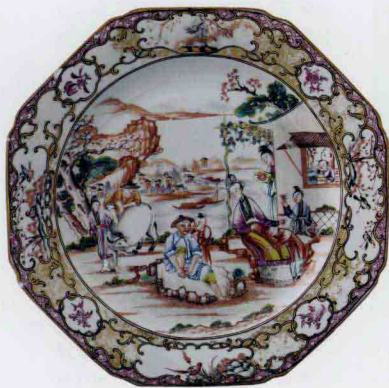
清雍正广彩农家乐园八方盘 高2.3cm/口径23.2cm/足径12.4cm