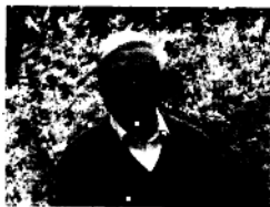
全国中学语文教学研究会 副会长张志公先生题词

知孤枕空用枕越晚 性相结合是这俗语的 不创十年来越办越好 生如盎然，日上五回 英相中，重盖白之产 首庄一推，万身可生，越 语文报创刊十周年！庆 无忘年夏 张志公